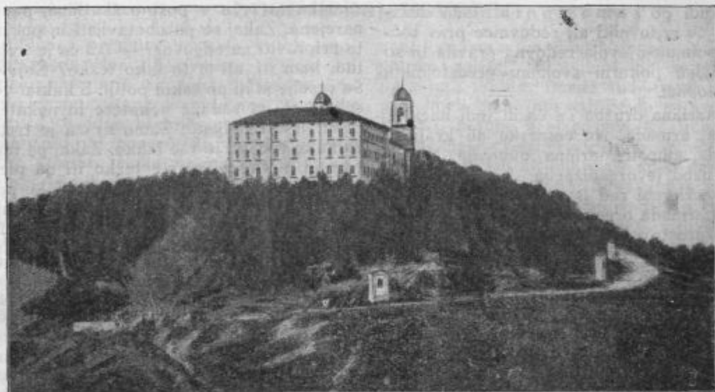
Misijonska hiša na Gradu pri Mirnu.

Stroga disciplina naprimer je pri v o - j a k i h. Vojaški poveljniki strogo ukazujejo, pa zahtevajo tudi natančen red in po-