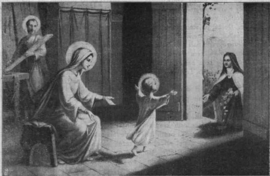
Terezika od Jezusa — ljubljanka njegova.

Zdaj veste, zakaj se tu končno gre. Za velike, za največje reči. Za vero, za duše, za srečno ali nesrečno večnost. In kdor to ve, ta bo storil vse, pa prav vse, kar more, da iztrebi iz njive naše domovine, svoje župnije, mesta in vasi, najprej pa domače hiše luliko slabega časopisja. Zato pa na noge v sveti boj, zdaj okoli Novega leta vsi, ki hočete, da ljudstvo vero ohrani, in da se duše ne pogublja'o. To je zdaj naša najvažnejša naloga. Boljše dela za Cerkev in Boga ne morete storiti, kakor je to. Na noge! Širite povsod katoliško časopisje! Vemo, da to ni lahko delo. Pa če boste imeli pri tem kaj prestati, veselite se in od veselja poskakujte, ker obilno je vaše plačilo v nebesih!