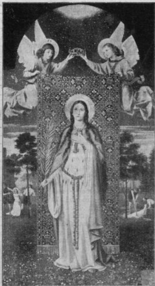
Vzor naših deklet — sv. Neža (21. jan.)

S tem je ob kratkem vse povedano. Kaj hočete še več? Gre se za duše, gre za večnost. Ne igrajte se z večnim ognjem...! Zdaj veste pri čem je s slabimi časniki. Povejte to tudi drugim, ki se tega morebiti ne zavedajo! Če si hočejo dati dopovedati,