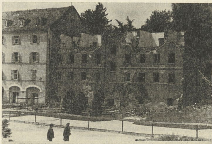
Rušenje Uradniškega doma. Staro se umika novemu.

V prvi fazi, ki bo predvideno gotova do začetka leta 1982, bodo zgrajeni vsi naštetih objekti, razen sprejemnice v terapiji in vezni hodnik med novim hotelom