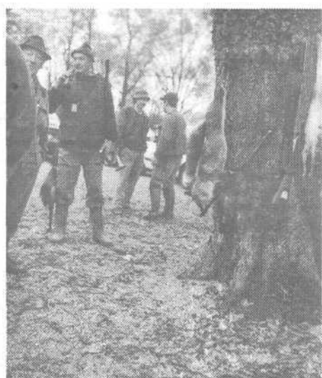
Drugi koncu je skočil zajec in me tako presenetil, da sem zamudil s strelom...