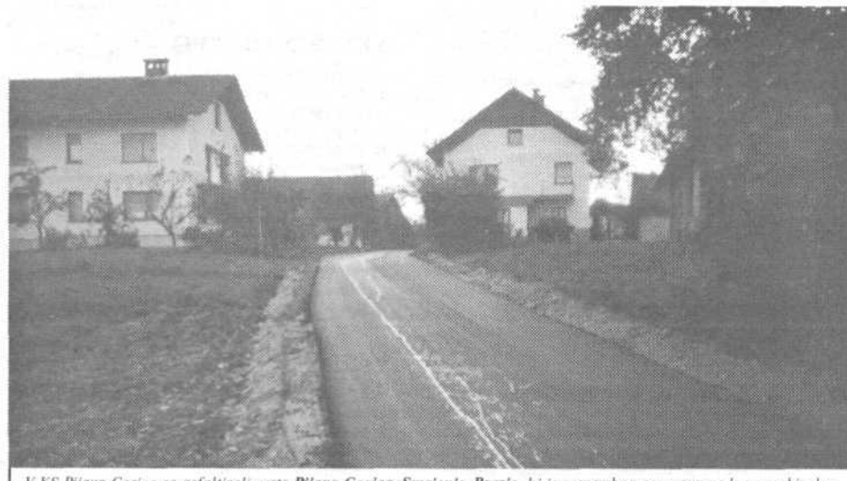
V KS Pijava Gorica so asfaltirali cesto Pijava Gorica-Smerenje-Brežje...