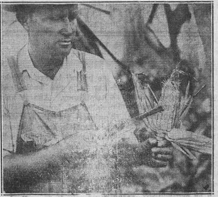
Nekei farmer blizu Louisville, Ky., kaže koruzni storž, na katerem se vidi posledice suše. Storžje namreč le na redko posijan z zrni.