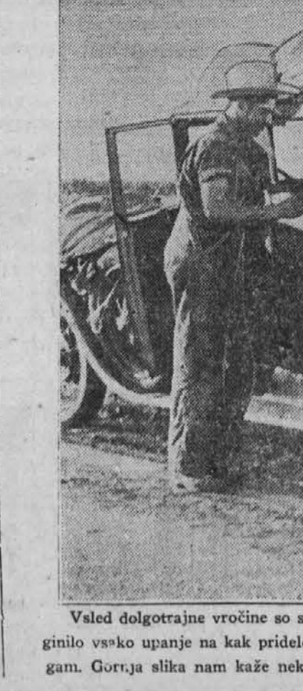
Vsled dolgotrajne vročine so se nekatere farme po zapadu in osrednjem zapadu tako izsušile, da je izginito vsako upanje na kak pridelek. Farmarji so zato enostavno zapustili svojo zemljo in se preselili drugam. Gornja slika nam kaže neko tako družino, ki je odpotovala iz Oklahome v Kantičnuje.