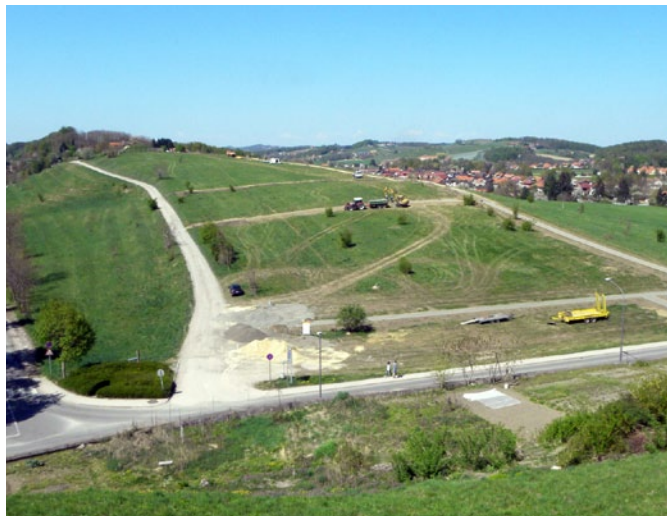
Na Panorami nastaja arheološki mestni park.

Prvi koraki k dolgo pričakovanemu arheološkemu mestnemu parku na Panorami so narejeni. S potmi je nakazana mreža ulic osrednje mestne četrti rimske Petovione. Pod njo so ohranjene rimskodobne ulice, med njimi pa so – pod travno rušo varno spravljene – ruševine gosto nanizanih stavb središča rimskega Ptuja.