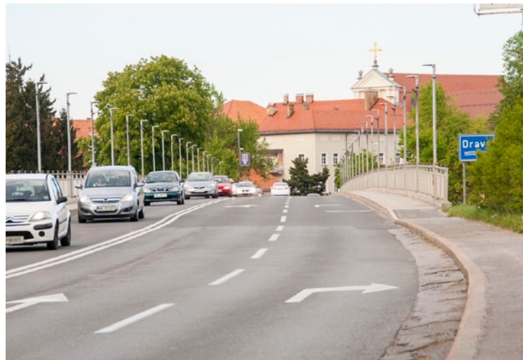
Stari most čez Dravo je tudi pomemben tehniški in kulturni spomenik.

Izvajalec rekonstrukcije mostu čez Dravo in Studenčnico na Ptujju je Pomgrad, d. d., s katerim je Direkcija RS za infrastrukturo 28. 3. 2017 podpisala pogodbo v vrednosti dobrih 4,5 milijona evrov. Delna zapora starega mostu (en pas) je predvidena s 15. majem, popolna zapora pa s 3. julijem 2017.