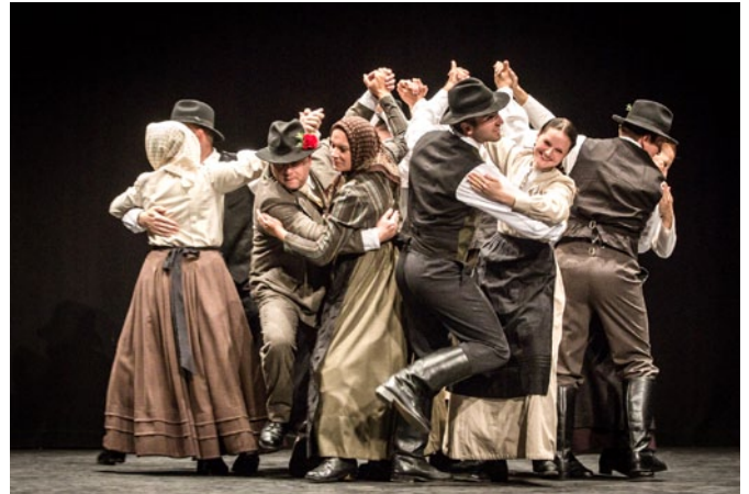
Folklorna skupina KD Rogoznica

Začetek bo 12. maja 2017 v Narodnem domu, ki že od leta 1882 daje streho ljubiteljski kulturi. Predstavilo se bo 16 skupin: Komorni moški zbor Ptuj, Mešani pevski zbor DU Ivan Rudolf Breg Ptuj, Ženski pevski zbor Društva prijateljev Pokrajinskega muzeja Ptuj - Ormož, Društvo ljudske pevke Jezero, Folklorna skupina KD Rogoznica, plesni skupini Društva Cesarsko-kraljevi Ptuj, Moški pevski zbor Jezero KD Budina - Brstje, Moški pevski zbor KD Grajena, Društvo kulturnih dejavnosti Vrtec – ženski pevski zbor, sekcije DPD Svoboda Ptuj; Likovna sekcija dr. Štefke Cobelj, Pevke ptujske upokojenke, Folklorna skupina