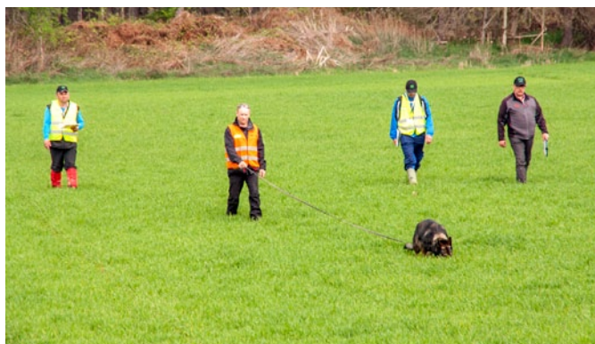
Na sledi vodnika in psa spremljajo sodnik, polagalec in 'križač'.