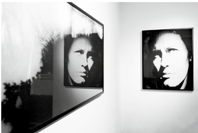
Razstava (Ne)znano, galerija Mikado, 2016