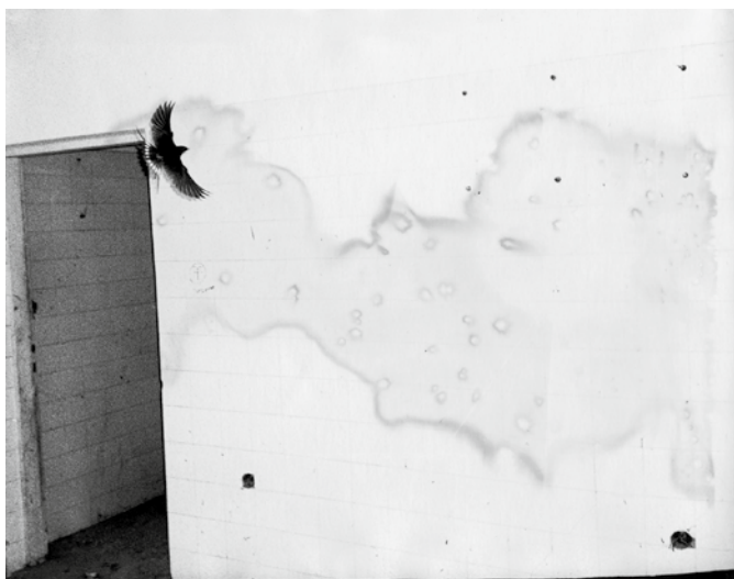
Iz serije Nokturno, 2016

nifestiralo v seriji fotografij Podoba podobe, kjer krajina postane prostor intervencij, ki govorijo o mojem pogledu na lokalno in širše globalno stanje duha. V času ustvarjanja serije Nokturno, za katero sem prejel Prešernovo nagrado, sem se ukvarjal predvsem z lastnim premikom od ustvarjanja z upodabljanjem k ustvarjanju z dejanjem. Takšen način dela me je usmeril od vprašanja 'kaj fotografirati' k vprašanju 'kako fotografirati'. Pomembno vlogo pri oblikovanju pomena fotografije oziroma serije pa pripisujem tudi gledalcu. Značilnost takšnega načina ustvarjanja je, da je končni umetniški izdelek unikat. Ustvarjalnega postopka namreč nikoli ne moremo ponoviti. Takšne fotografije so diametralno nasprotje 'čiste fotografije' (angl. straight photography), katere namen je reprezentacija realnosti.