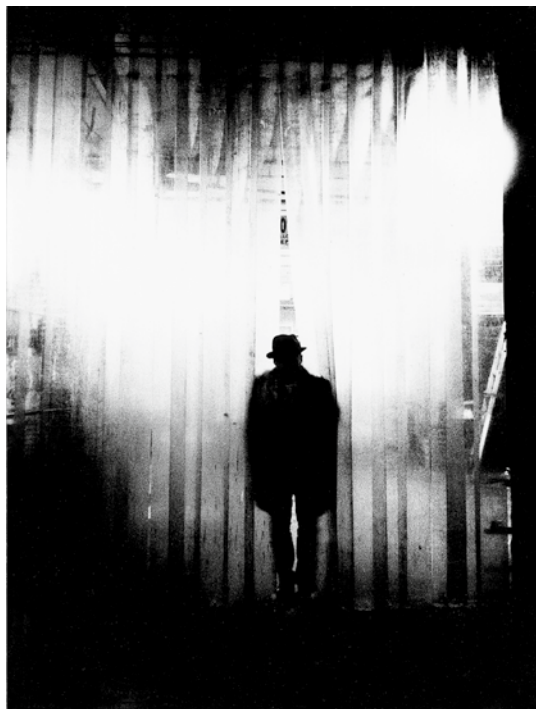
Iz serije Nokturno, 2016

nifestiralo v seriji fotografij Podoba podobe, kjer krajina postane prostor intervencij, ki govorijo o mojem pogledu na lokalno in širše globalno stanje duha. V času ustvarjanja serije Nokturno, za katero sem prejel Prešernovo nagrado, sem se ukvarjal predvsem z lastnim premikom od ustvarjanja z upodabljanjem k ustvarjanju z dejanjem. Takšen način dela me je usmeril od vprašanja 'kaj fotografirati' k vprašanju 'kako fotografirati'. Pomembno vlogo pri oblikovanju pomena fotografije oziroma serije pa pripisujem tudi gledalcu. Značilnost takšnega načina ustvarjanja je, da je končni umetniški izdelek unikat. Ustvarjalnega postopka namreč nikoli ne moremo ponoviti. Takšne fotografije so diametralno nasprotje 'čiste fotografije' (angl. straight photography), katere namen je reprezentacija realnosti.