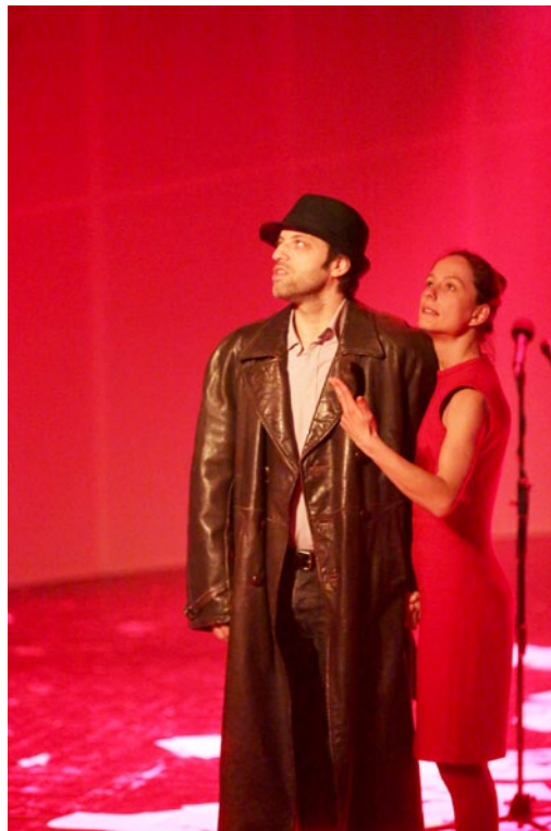
Iz predstave Mehanični levi

»To je prava pasja radost, veliko priznanje in veselje za naše pasje gledališče. Ne nazadnje ima za nas ta nagrada še posebno težo, saj nam jo je prisodilo občinstvo, za vas, naši gledalci, pa tudi ustvarjamo predstave. Pa seveda, že sedma nagrada v tej