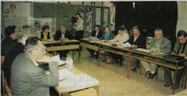
Svetniki Občine Komenda zasedajo v osnovni šoli v Mostah.

Naslednja, velikonočno in ob občinskem prazniku obarvana številka Kamniškega občana bo izšla v četrtek, 25. marca. V njej bomo objavili tudi vaša voščila. Sporočite nam jih čimprej! Prispevke oddajte najkasneje do srede, 17. marca; zahvale, oglase in obvestila pa najkasneje do torka, 23. marca.