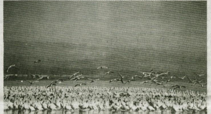
Zborovanje flamingov (plamencev)

Tako kot v Masai Mari se tudi tu giblje povprečna letna temperatura okrog 18°C. Padavin je okoli 930 mm. Večino parka zavzema plitva voda jezera Lake Nakuru. Zahodno od jezera se dviga strm breg vzhodno afriškega Velikega tektonskega jarka, na vzhodu