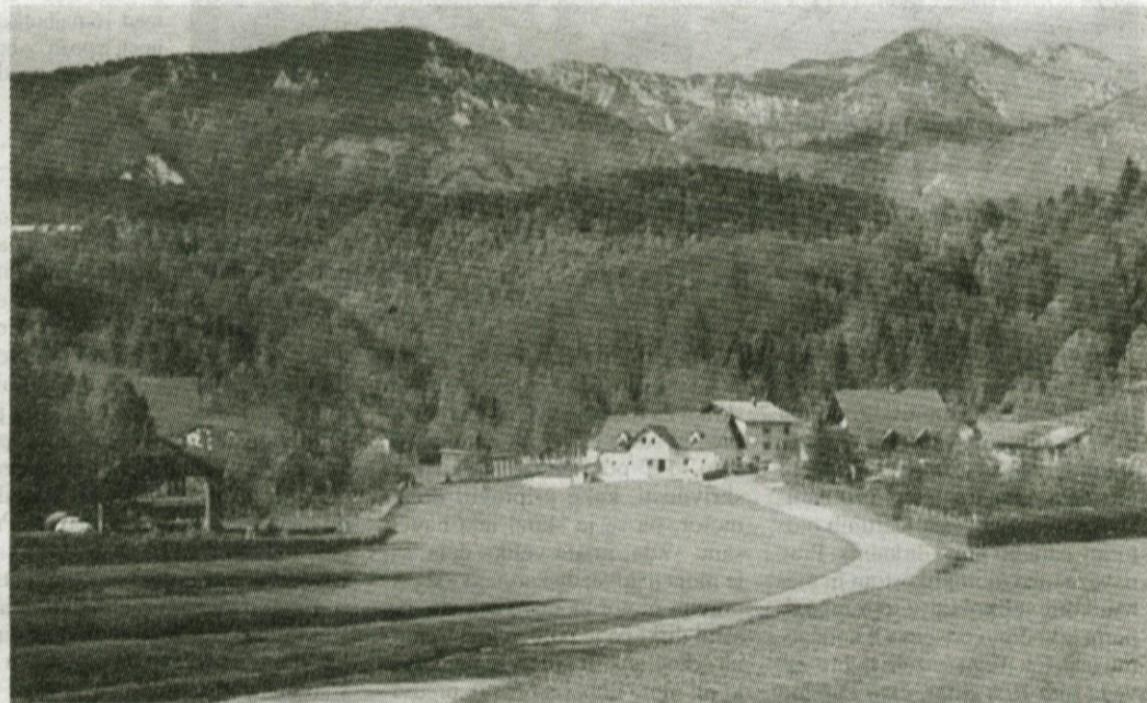
Ko se na poti iz Laniš ozremo nazaj, se nam iz idilične dolinice pogled odpira na Pokovške (križišče), Veliki zvoeh, Košutno in Kompotelo.