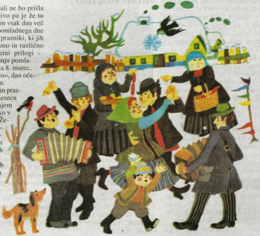
JUHUU... Družinski klub je tu (ilustracija Lidije Osterc)

Tudi »himno« si lahko izberemo, morda Šiferjevo Za prijatelje, kakšno Smolarjevo ali morda tisto narodno Včasih je lušno b'lo. Slednja se meni osebno zdi zelo primerna predvsem zaradi leta, ki je »posvečeno« starejšim, starim. Tudi v na-