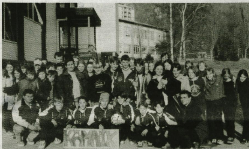
Navijači in nogometaši OŠ Frana Albrehta pred športno dvorano v Hrastniku.