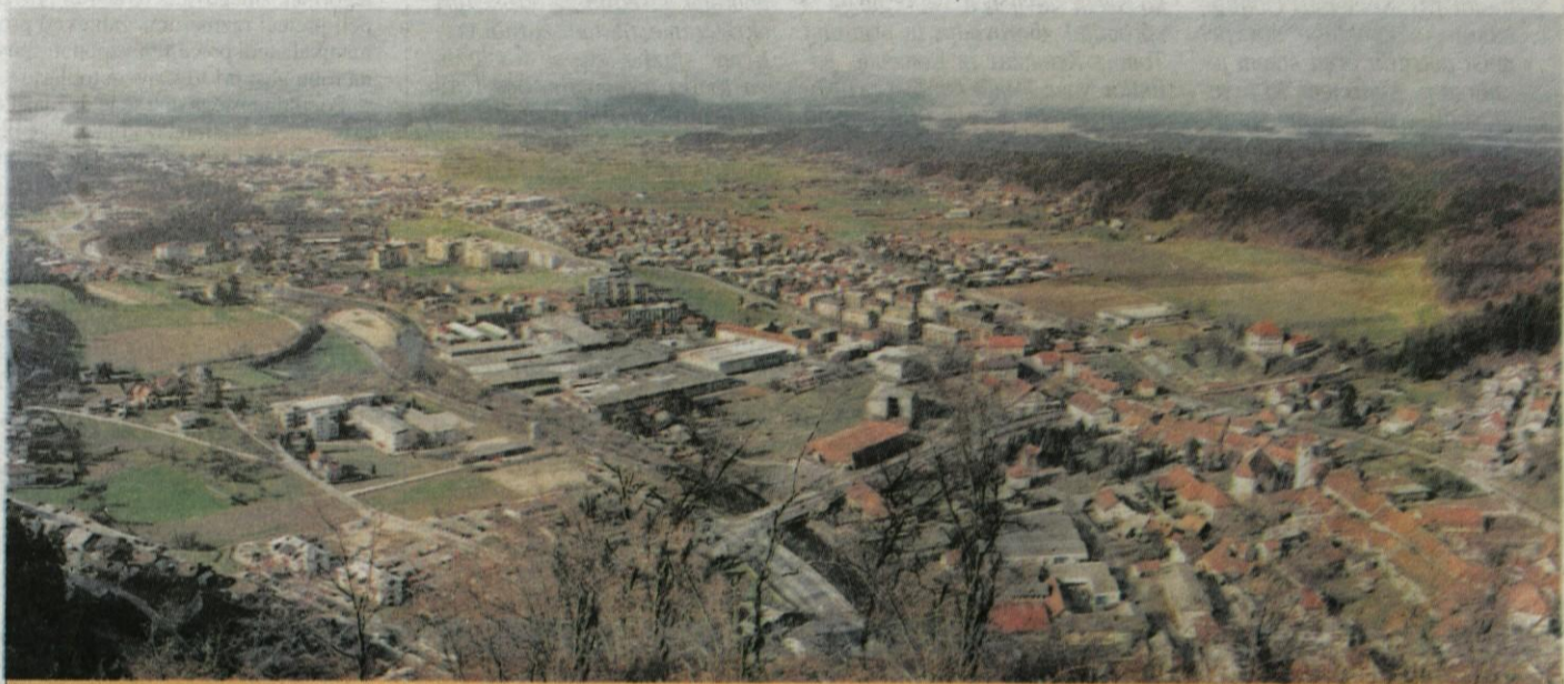
Pogled s Starega gradu na južni del kamniške občine - Letos prvič praznujemo v zmanjšani občini, brez Komende, Križa in Most, vendar še vedno v eni največjih slovenskih občin.