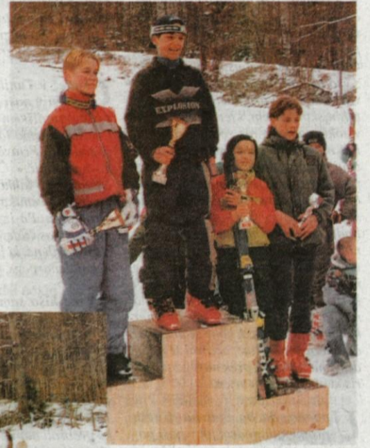
Najboljši v veleslalomu

Proga je bila dobra pripravljena, motil me je samo kolovoz, ki je bil speljan prek proge. To je bila mo-