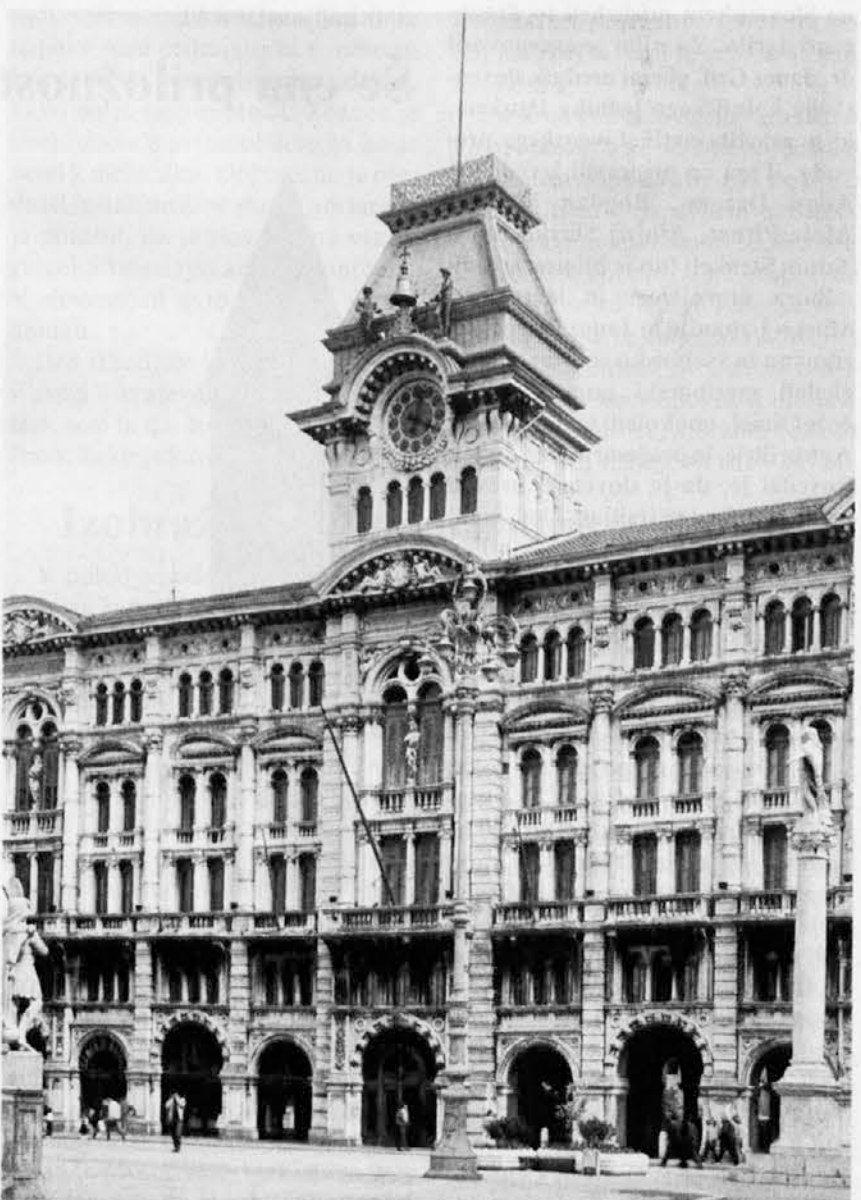
Tržaška občinska palača pričakuje novega župana