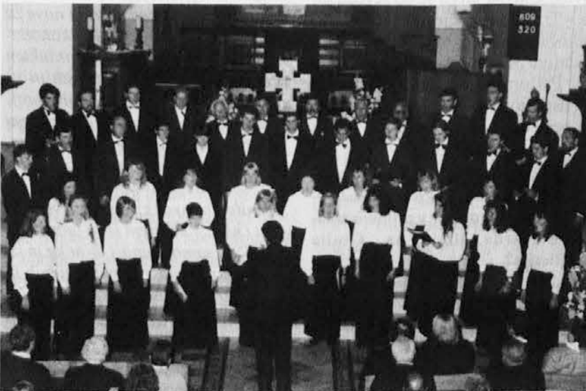
Pevci zbora Hrast med celovečernim koncertom v Maasmechelemu (Belgija) med Slovenci