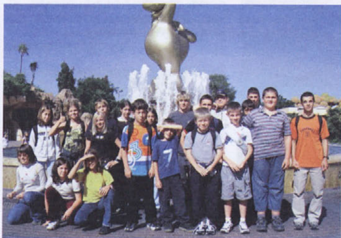
Dvajset razigranih: "Gardaland, prihajamo!"

Dvajset in en vesel otrok in njihovi skrbniki; dvajset jih je dan preživel v zabaviščnem parku Gardaland, Dejan pa si bo zapomnil dan, ko se je po Žlebeh vozil na motorju.