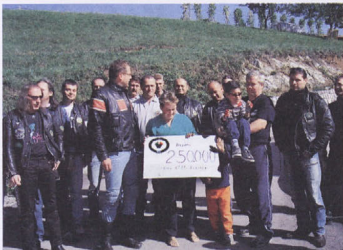
Motoristi: "Ček za 250 tisoč tolarjev."