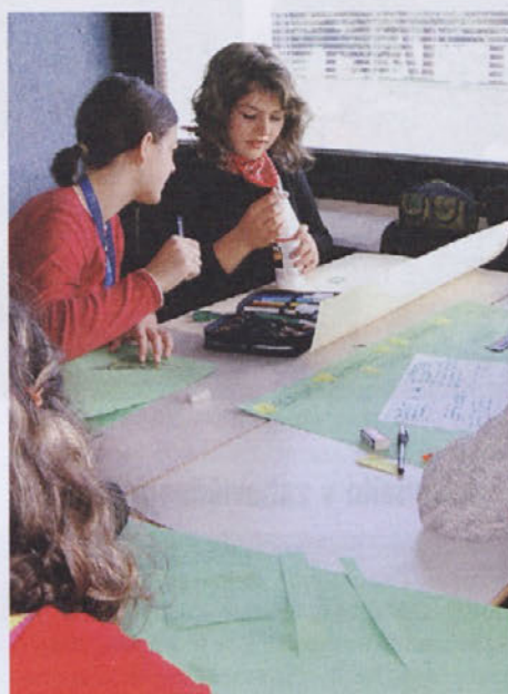
Plakati za nove športne dogodke.