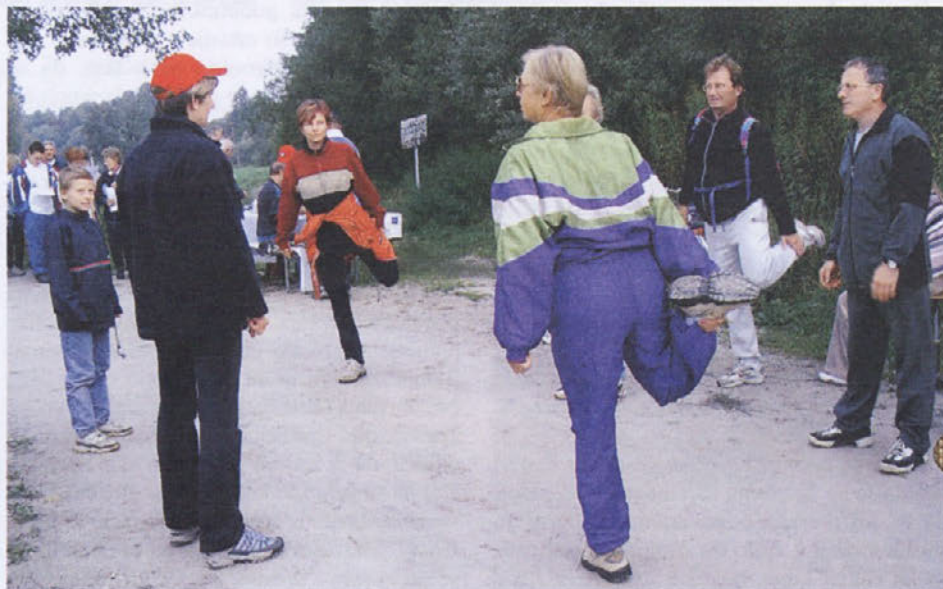
Najprej nekaj vaj za raztezanje, potem pa hitra hoja na dva kilometra.