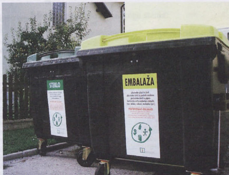
Snaga po vsej občini.