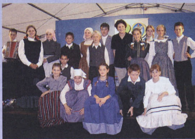
"Ta velk otroc" v ta novih oblekah.