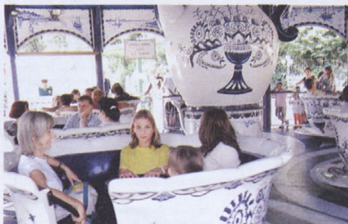
Nika: "Tole bo najbolj varno prevozno sredstvo."