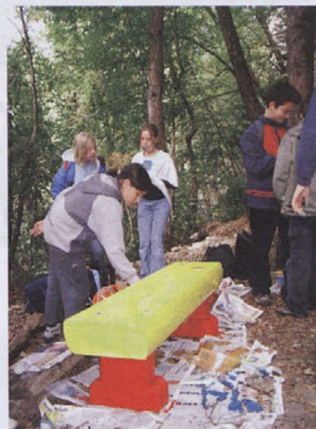
Klopi v plezališču pod Turncem.