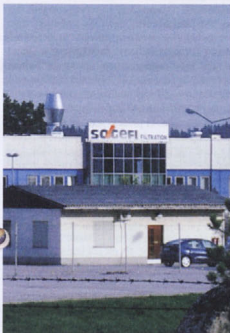
Krajane moti dim, ki se le občasno kadi iz podjetja.