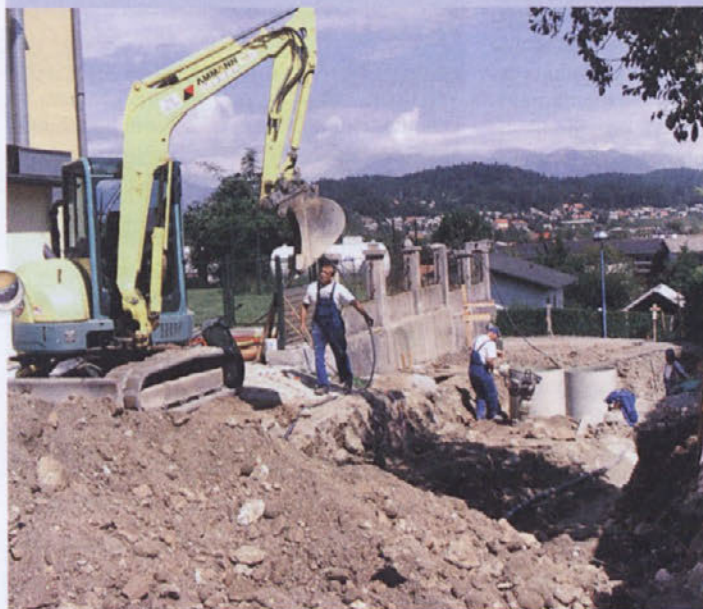
Kanalizacija, vodovod in cesta.

Konec avgusta je izbrani izvajalec del, podjetje Komunalna gradnja Grosuplje, začel z gradnjo meteorne in fekalne kanalizacije na trasi od OŠ Preska do obstoječega priključka na Barletovi cesti. Na ta način bo občina zadostila zahtevam, ki jih imajo soglasodajalci ob načrtovani gradnji prizidka k osnovni šoli, hkrati pa bo rešila tudi dolgoletni problem poplavljanja, ki so ga ob nalivih občutili predvsem krajani na Kalanovi cesti. Doslej sta bili namreč po isti cevi speljani tako fekalna kot meteorna kanalizacija. Hkrati bodo obnovili tudi vodovodno omrežje, asfaltno prevleko in dovoz do šole. Celotna naložba, ki naj bi bila zaključena do konca leta, je ocenjena na 75 milijonov tolarjev, pokrila pa se bo iz sredstev Holdinga Ljubljana in Komunale Kranj.