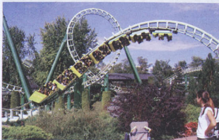
Sašo: "Fantje, ste spraznili žepe?"

"Seveda bomo Dejana še enkrat zapeljali z motorjem po vasi. Gotovo je to zanj bolj pomemben dogodek kot pa ta simboličen znesek v višini 250 tisoč tolarjev, ki smo ga člani moto