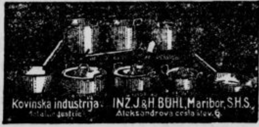
Kovinska industrija - INŽ. J & H BUHL, Maribor, S.H.S., Kraljeva cesta 6

Ta garnitura kuhinjske posode je iz najboljšega aluminija, snežno-bela in desetletja trpežna. — Dobavila se proti predplačilu ali po povzetju. Cenik brezplačno. — Insetat priložiti. — Ako bi ne ugajalo, se vzame radevoljno nazaj.