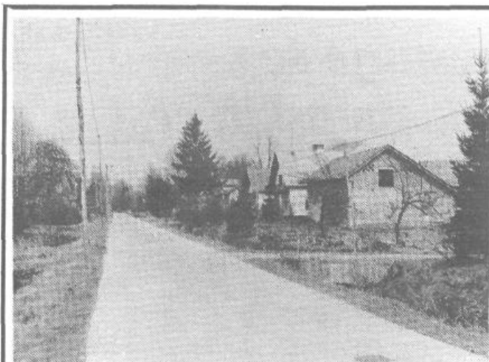
Črna vas: vsakoletne poplave so še vedno največja nadloga

Člani, ki še niso poravnali članarine, bodo prejeli položnice po pošti.