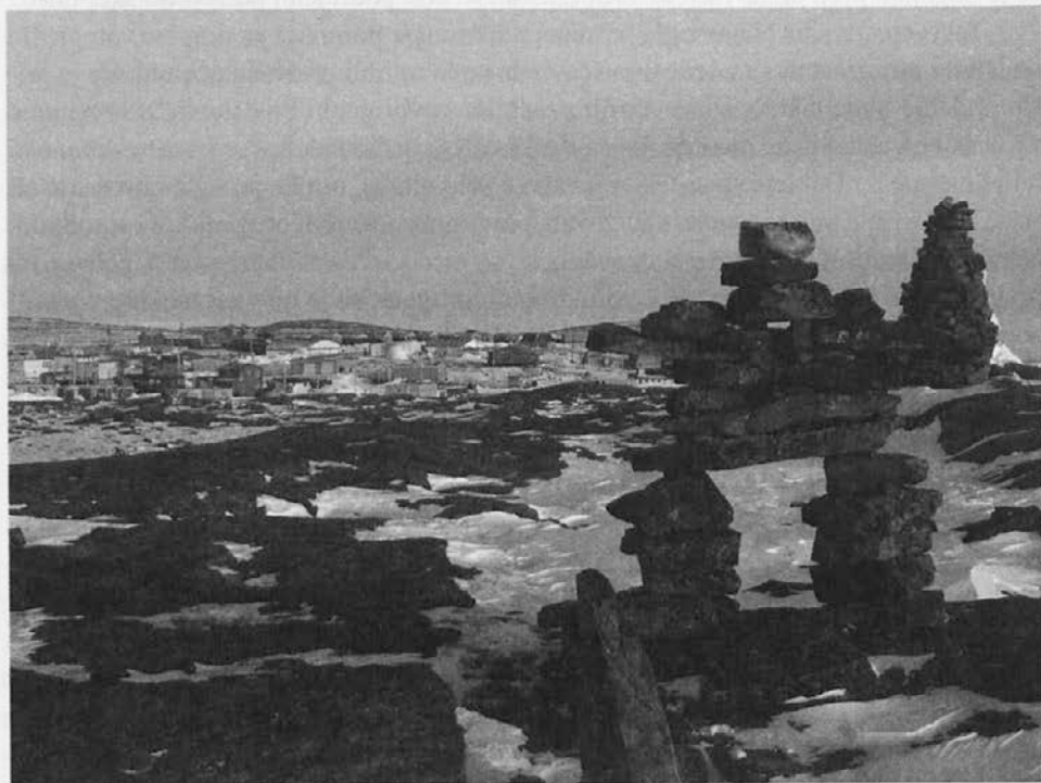
»Imukšuk«, v ozadju naselje Repulse Bay.