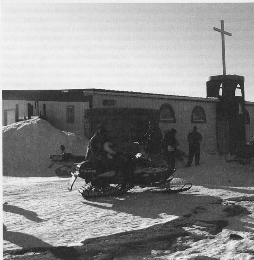
Verniki po maši pred cerkvijo.

3. Postavlja se vprašanje, ali bodo Inuiti sposobni iz obeh kultur potegniti najboljše. Za njihovo kulturno preživetje se sicer še vedno kažejo možnosti, predvsem z razvijanjem »zdravega« načina turizma, ki bi mlajše generacije pripravil do tega, da bi bile bolj ponosne na lastno kulturno izročilo. Pozitivno je dejstvo, da arktična ljudstva v zadnjem obdobju vzpostavljajo stike na različnih področjih, kot na primer Arktične igre, ekološka gibanja itd. Takšni procesi pomagajo graditi samospoštovanje, ki je najbolj pomembno za ohranitev določene kulture.