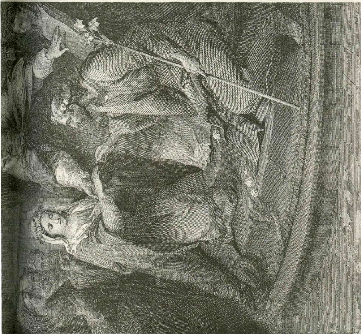
Zaroka Marije in sv. Jožefa. (Slikal Karol Vanloo.)

Lah je med tem zlezl pod klop ob steni in klical neprenehoma: „Madre, madre!“