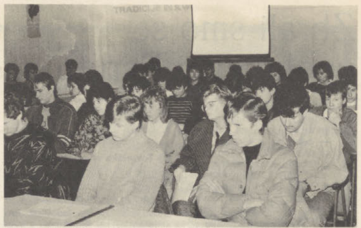
Odbor kluba štipeidistov pri Perutnini Ptuj sestavljajo:

● Sklepi so sprejeti, če zanje glasuje več kot polovica prisotnih članov.