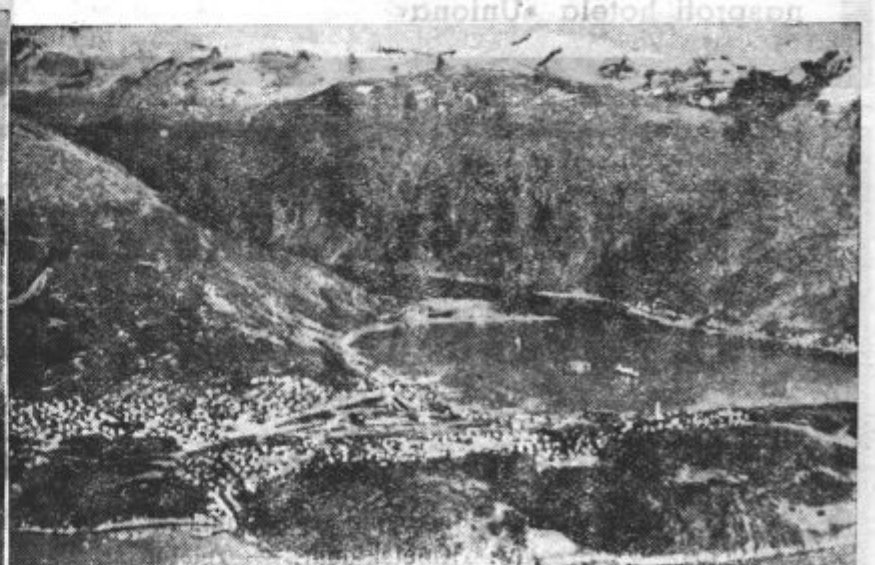
Levo: Norveško pristanišče Bergen, ki ga je zasedla nemška vojska. Desno: Pogled na Narvik, ki ga po zadnjih vesteh zasedajo Angleži.