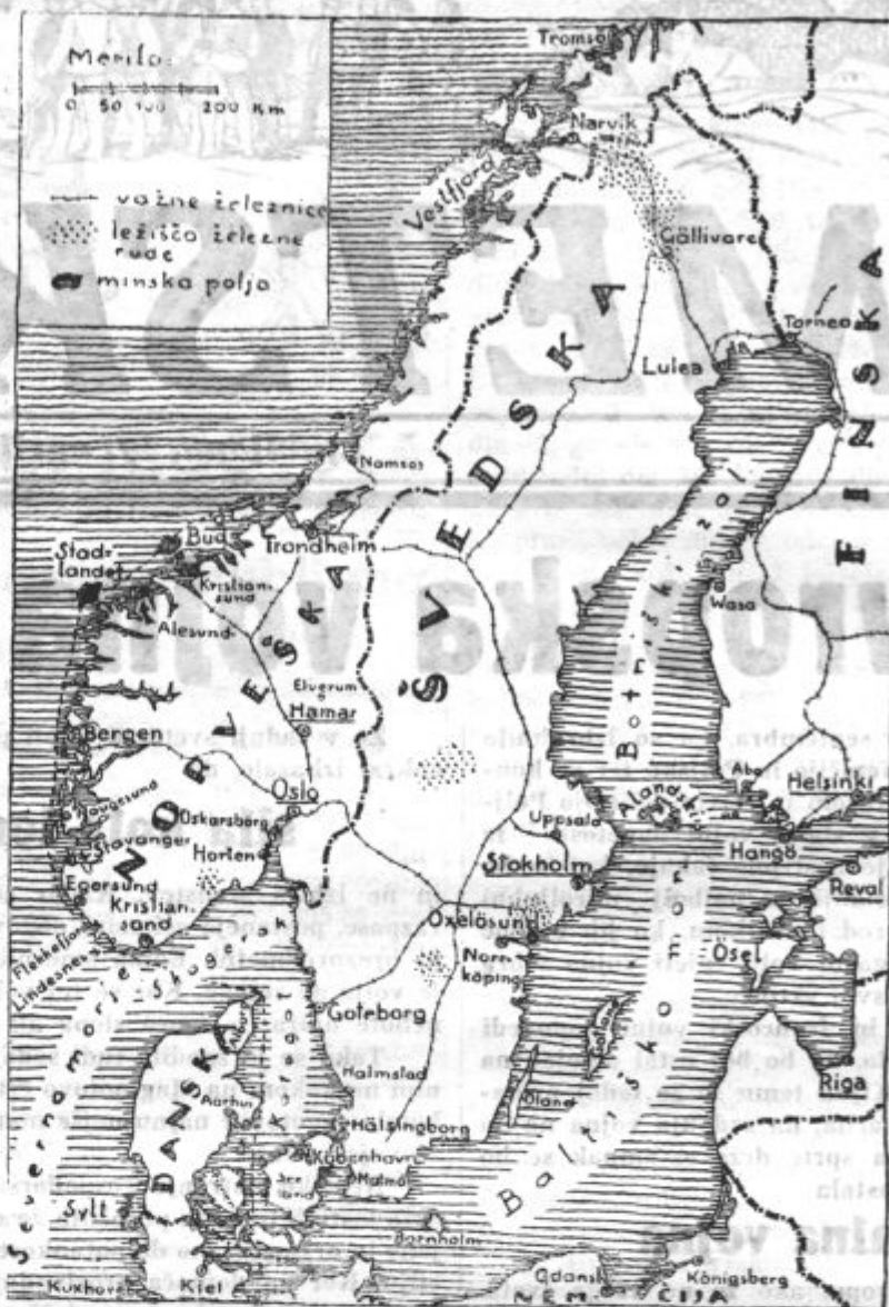
Severne države so zadnje čase pozorišče najbolj srditih in krvavih bojov v sedanji vojni. Po zemljevidu bodo čitatelji lažje razumeli potek dogodkov.

Na evropskem jugu je Italija, ki vzdržuje tako zvano oboroženo nevtralnost. Dasi doslej še