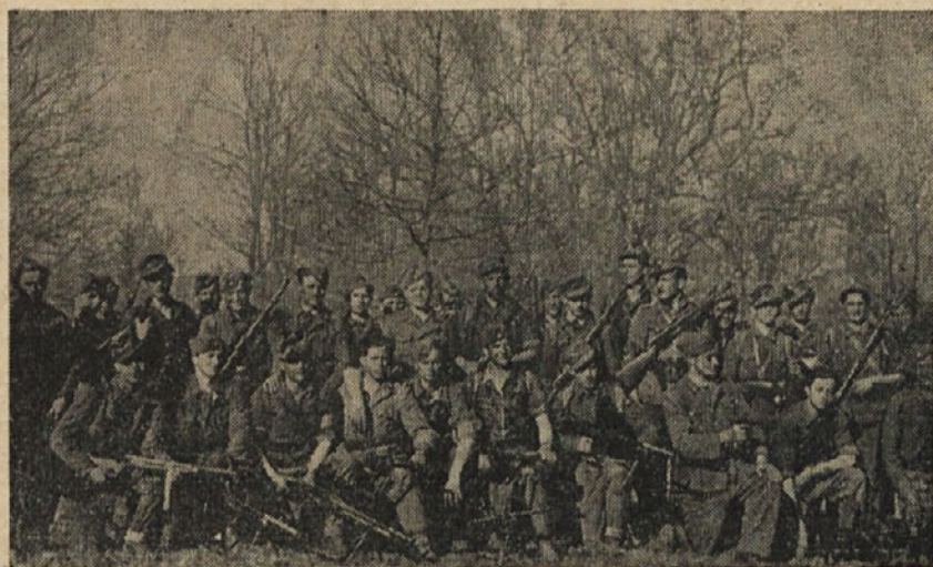
Skupina Domobrancev 16. čete na pohodu v kočevskih gozdovih maja 1945

Oni, ki jim izkazujemo le skromno pozornost, so nam darovali svoje zdravje in srečo — naši invalidi. Se jih kdaj spomniš?