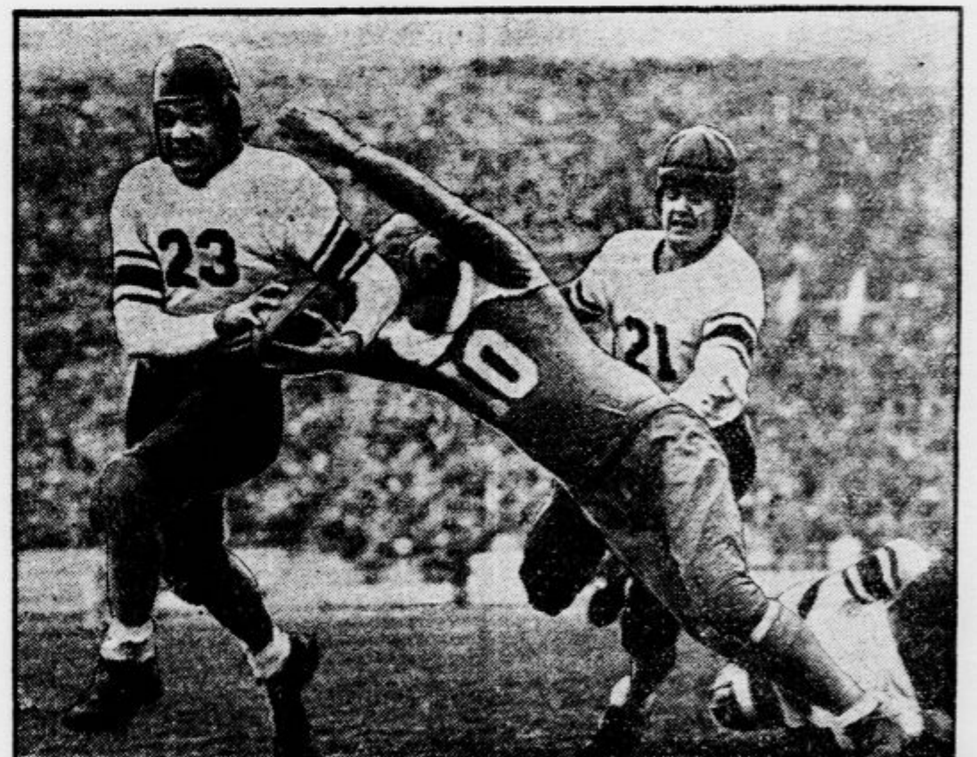
Prizor iz neke ameriške tekme v rugbyju