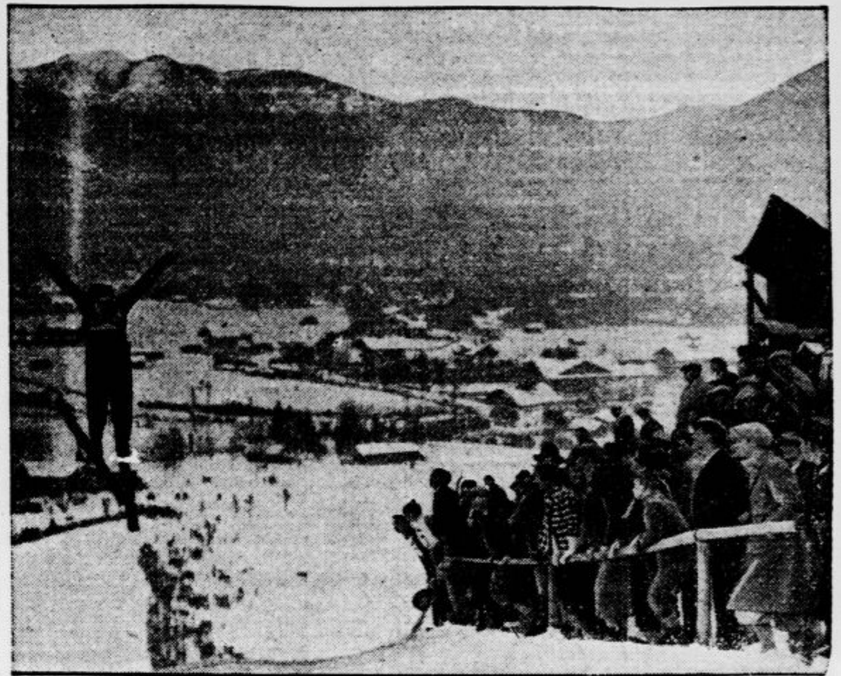
Krasen smučarski skok s Kochelbergove skakalnice na Bavarskem