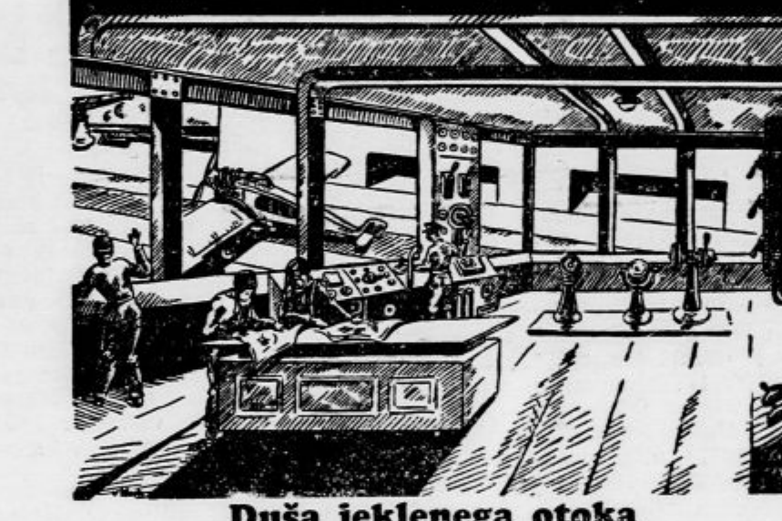
Duša jeklenega otoka

Slika prikazuje strojno centralo plavajočega oporišča za zrakoplovni promet, kakor je predstavljeno v velikem filmu »F. P. 1« ne odgovarja.