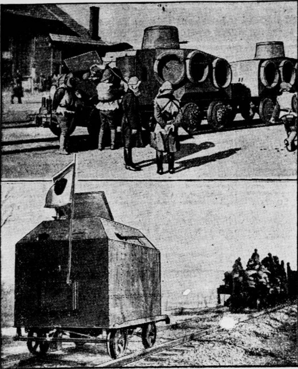
Japonska bojna oprema na pohodu v Peking. Zgoraj: Japonski oklopni avtomobil na tračnicah. — Spodaj: Vagon najnovejšega japonskega oklopnega vlaka