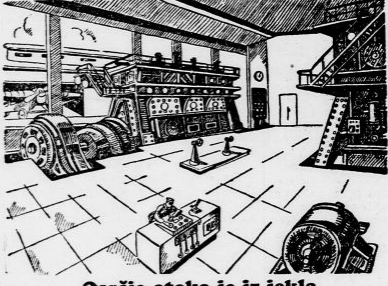
Osrče otoka je iz jekla

Atlantska depresija je povsem oslabela, njen vpliv je od Evrope domala popolnoma odstranjen; tudi zapadno Evropo je zasegal hladni tok od vzhoda in celo nad velikobritanskim otočjem se je temperatura približala ničli. Seveda morajo oni kraji tako rekoč čez noč priti pod gospodstvo nove, ali ojačene atlantske depresije, ali do naših krajev atlantski vpliv ne more sedeti tako brž. Dvigavanje barometra kaže kako se preko nas raztega močna ruska anticiklona.