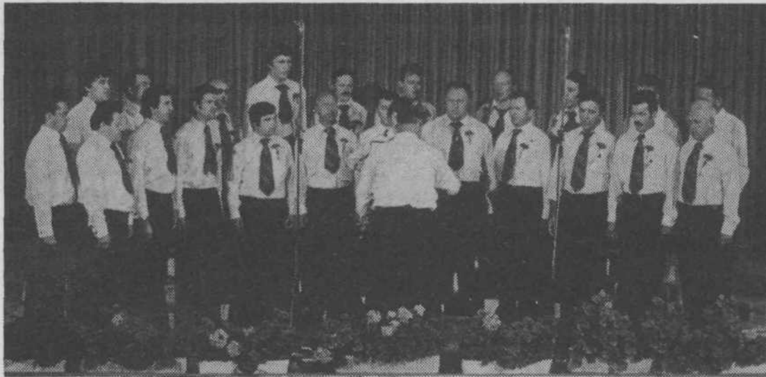
Moški pevski zbor KUD Bizovik na letošnji reviji pevskih zborov v Šentvidu pri Stični

Moški pevski zbor KUD Bizovik uspešno deluje že približno dve leti. V tem času se je kvaliteta njihovega petja občutno povečala. Ker je to eden redkih zborov naše okolice, naj njihovo