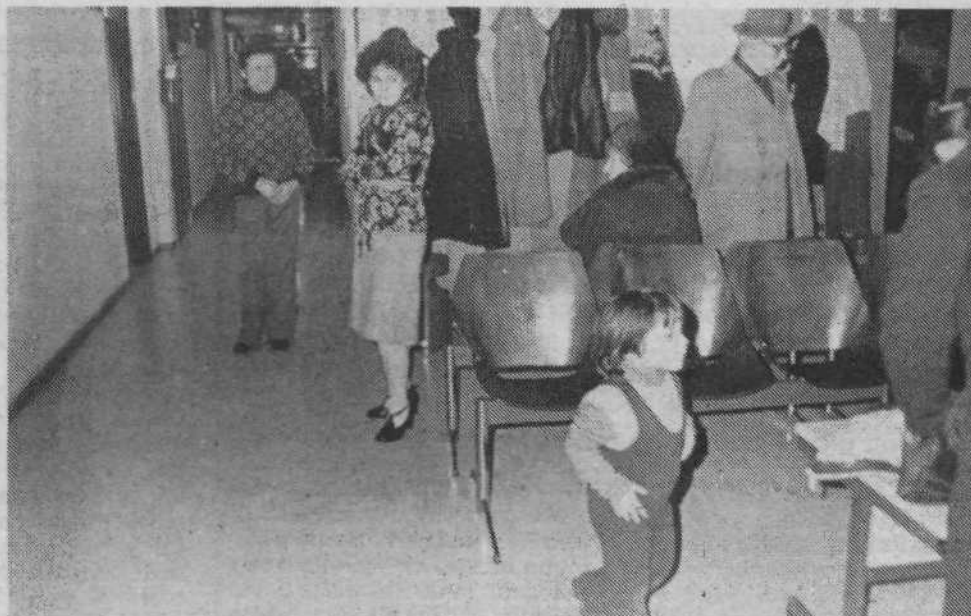
Notranjost novega zdravstvenega doma je sodobno urejena

ko v miru študira. Tu igrajo prvo violino zdravniki splošne medicine, specialisti so le njihovi pomočniki, kajti preventiva je prva, potem je še kurativa.«