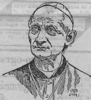
Kardinal Fürstbischof v Salzburg Dr. Joh. Katschthaler

Knez in nadškof v Salzburgu, kardinal dr. Johan Katschthaler je umrl. Rojen je bil 29. maja 1832 v Hippachu na Tirolskem. Studiral je na dunajski visoki šoli in postal l. 1856 duhovnik. L. 1886 postal je ravnatelj duhovniške-