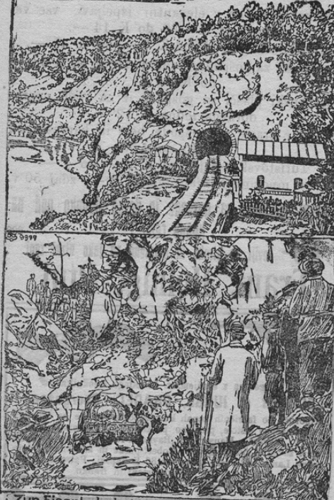
Zur Eisenbahnkatastrophe im Haussteintunnel bei Chemnitz.

Sachsen spremljala je ta vihar huda nevihta, podobna potresu. Vsled tega se je omenjeni tunel ravno v trenutku podrl, ko je došel osebni vlak. Naša slika kaže vhod v ta podrti tunel, v katerem ležijo še zdaj razbiti kosi vlaka.