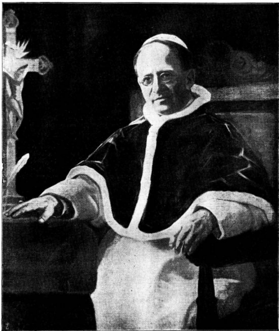
Sv. oče Pij XI.

jino pa je bilo vsikdar svetla luč v hiši in v življenju sv. katoliške cerkve. Še več. Češčenje Marijino je naravnost pravec in merilo, ki nam kaže, koliko svetlobe in