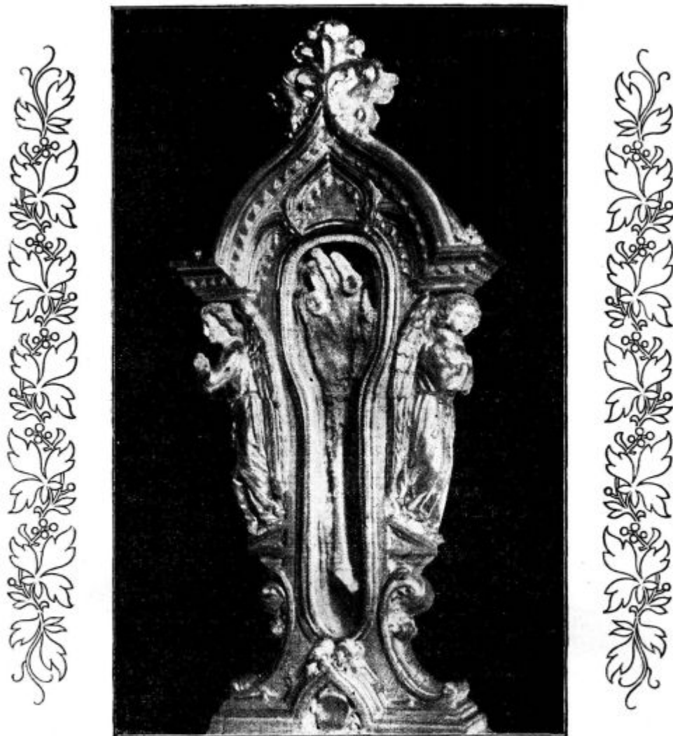
Relikviarij z roko sv. Frančiška Ksaverija.