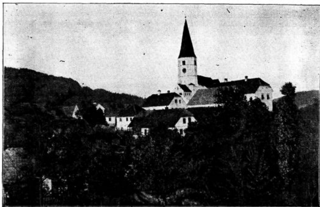
Sv. Marija Zagorska.

»Ja, odkod pa vidva?!« Bila sta to še mlada fantiča od kakih 16—18 let. »Iz Ribnice.« »Ja, pa prav odkod, le natančno mi povejta, ali menita, da jaz ribniške doline ne poznam?« Malo čudno sta gledala, kako da tukaj v Gorici en gospod hoče vsako luknjo na Kranjskem poznati, da mu ni zadosti Ribnica in hoče natančneje vedeti. »Prav izpod Nove Štifte.« »A tako, potem sta pa iz sodraške fare!« Fantiča sta se mi zdela nedolžna in dobra. Zato ju vprašam: »V Sodražici imate Marijino družbo za fante, ali sta