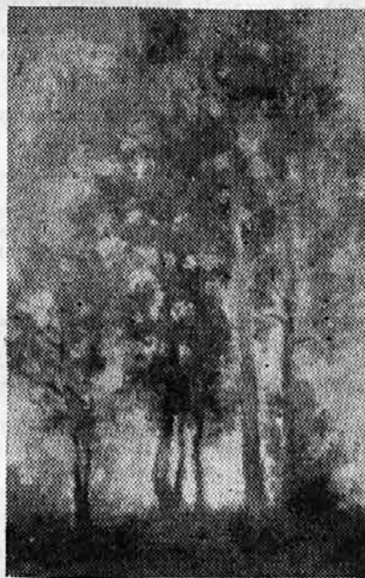
R. JAKOPIČ -- BREZE

Velike zasluge ima tudi kot organizator umetnikov. V Tivolskem vrtu v Ljubljani je seveda paviljon, ki nosi po njem ime in služi za umetnostne razstave.