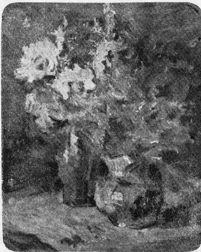
R. JAKOPIČ -- CVETJE

Umetnostni kritik in zgodovinar Izidor Cankar sodi, da je Jakopič šel skozi tri obdobja umetniškega razvoja. Začel je z naturalističnim impresionizmom, ki je osnovna podlaga tudi ostalih treh vodilnih slovenskih impresionistov (Jame, Groharja in Sternena) nadaljeval z realističnim impresionizmom, ko je skušal s smotrno zbrano kompozicijo in osvetljavo dvigniti naravni pojav do nadnaturalistične pomembnosti, ter zaključil z barvnim ekspresionizmom, ko je z barvo izražal duhovni značaj naslikane stvari.