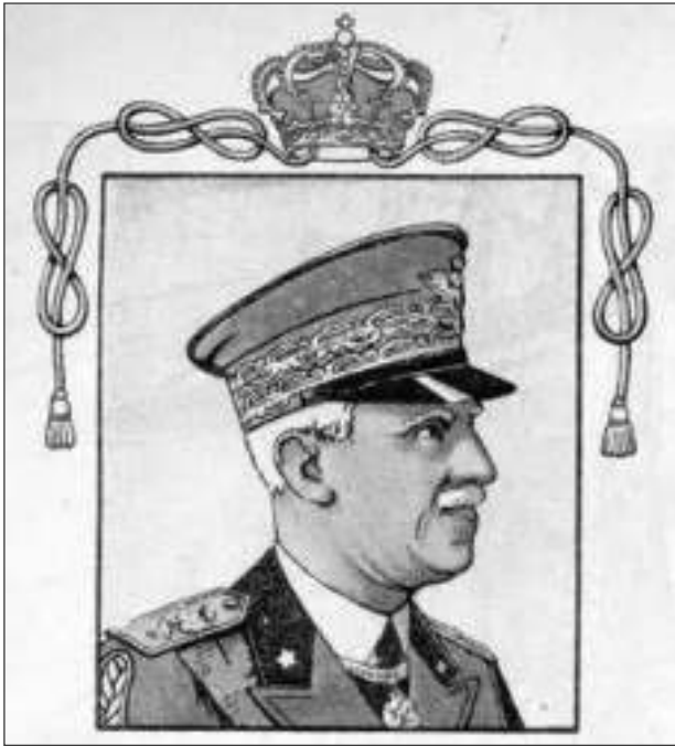
Slika 1: Ilustracija Viktorja Emanuela III.

Svojski / Kralj vojak / Zmagoviti kralj / Vsa Italija ga ljubi / Skupaj mu kličemo / Naj živi kralj!« 7