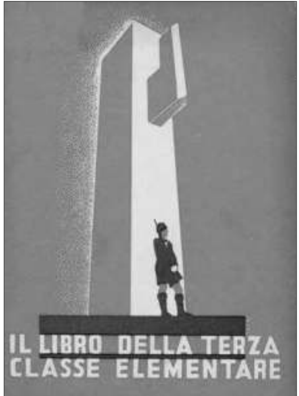
Slika 4: Naslovnica berila, na kateri sta upodobljena vojak in simbol fašizma (Nazareno Padellaro, Carlo Testi: Il libro della terza classe elementare , naslovnica)

V primerjavi s kraljem je avtor pri opisu Ducejeve slike šel še dlje v nameri vzbuditi pazljivost, predanost in strahospoštovanje. V prebranem besedilu lahko hitro prepoznamo gojenje kulta osebnosti, saj gre za figuro, ki v pozitivnem (vodi in varuje) in negativnem (opazuje in nadzira) smislu bdi nad ljudmi.