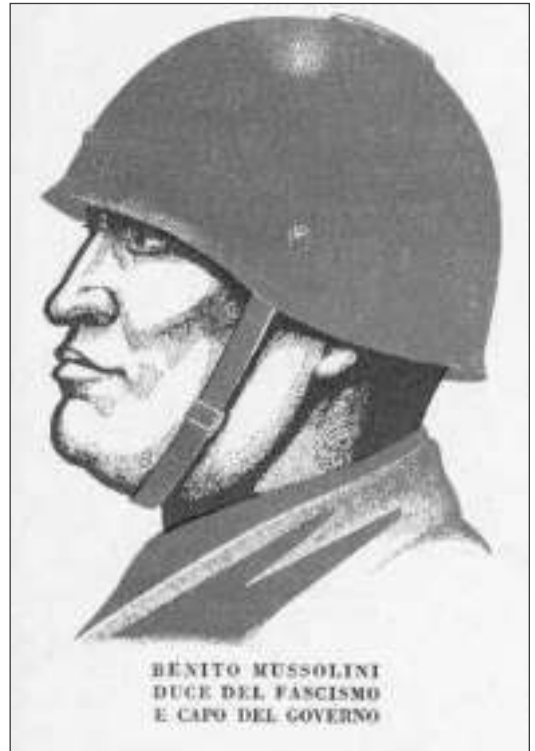
Slika 5: Portret Benita Mussolinija (Nazareno Padellaro, Carlo Testi: Il libro della terza classe elementare , str. 7)

Vsi ti odstavki so pisani na način, da bi otrokom vzbudili zavest in čut za pripadnost kralju in domovini, ter na način, da bi otroci vzljubili in spoštovali kralja, da bi nekoč postali zvesti in ubogljivi državljeni.