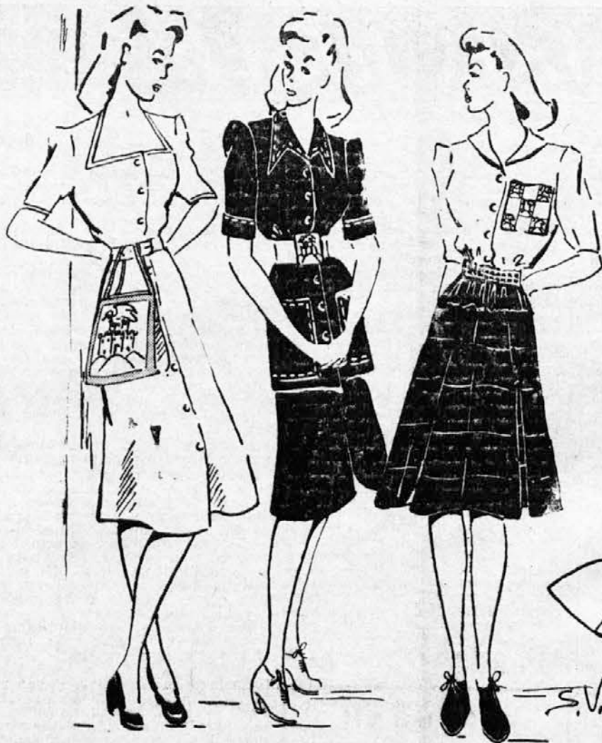
(Ti trije modeli so risani izrečno za »Družinski tednik« in niso bili še objavljeni.)

Ko je isti lantček po nekaj mesecih narisal isti motiv, je bil čisto prerojen. Hiša je sveta in stoji na sredini. Okrog nje rasto cvetlice, skala je izgubila, v levem kotu sije sonce. Pozneje je psiholog izvedel, da sta se dečkov oče in mati, ki sta bila prej sprta, res ta čas spravila in da