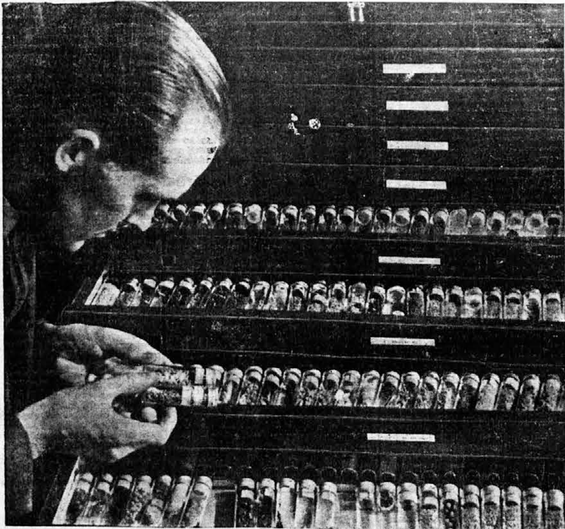
La fotografia rappresenta un cassettino in cui un botanico esperto conserva semi d'ogni specie. Una bella pianta può germogliare solo da un seme, giovine e sano, pieno di fecondità. Tra i semi si scelgono i migliori per la semina. Proprio ora, in tempo di guerra, dobbiamo coltivare le piante migliori, secondo gli insegnamenti della scienza che tende a secondare tale proposito. In quasi tutti gli Stati più evoluti esistono istituti speciali ove vengono esaminati i semi dei diversi cereali e di altre utili piante. Tale lavoro è affidato a esperti diplomati, che per assolvere bene il loro compito devono possedere grande esperienza e vaste cognizioni teoriche. — Gornja slika nam kaže predalnik, kjer izsolan rastlinoslovec hrani razno semenje. Lepa rastlina požene samo iz zdravega, mladega semena, ki ima še vso oploditveno moč. Razne vrste semen primerjajo in izbere najboljše za selev. Prav zdaj v vojni je potrebno, da gojimo samo polnovredne rastline, zato se je razvila že prava znanost, ki podpira ta stremiljena. Skoraj vsaka naprednejša država ima poseben zavod, kjer urejajo in pregledujejo semena raznih žitaric in drugih koristnih raslin. Delo je poverjeno izsolanim strokovnjakom, ki morajo imeti ogromno teoretičnega znanja, če naj s pridom vrše svojo nalogo.

Ob propadu Medicejev je živelo v Rimu 30.000 družin, torej nekako 120.000 ljudi. Ob pričetku sedanega stoletja je šlo svetlo mesto 460.000 prebivalcev, odlej je pa krivulja prebivalstva spet stalno naraščala in dosegla v oktobru l. 1937. 1.240.000 glav.