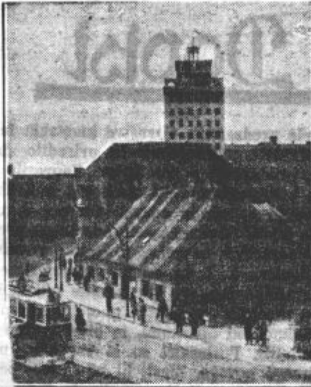
Spredaj slavni »Figovec«, v ozadju »nebotičnik«.

Pri nas človek še čestokrat sliši v veseli družbi petje od »Ljubljance, dolge vasi...« Tudi vedo starejši ljudje marsikaj povedati o stari Ljubljani, kakšna in kako je izgledala še pred nedavnim časom. Pa tudi mnogo dokazov je še, ki spominjajo na obliko stare Ljubljane. »Figovec« skoraj vsakdo pozna; človek bi dejal prav skromna, plaha hiša, pa se je vendarle v