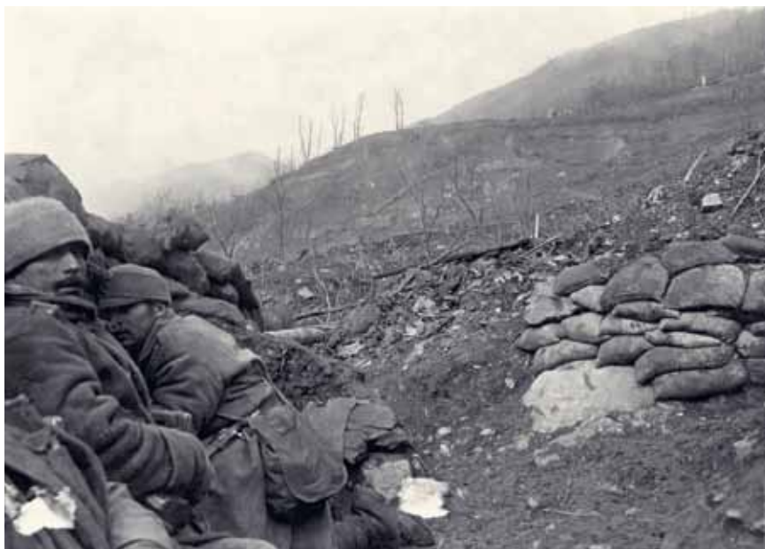
Ljudi je strah in pokrajina je opustošena. (Vojaško-zgodovinski muzej Budimpešta)

Poti miru, ki jo je Fundacija poti miru v Posočju posvetila spominu na gorje vojakov in prebivalcev doline, ima pet odsekov, in sicer Log pod Mangartom–Kal Koritnica (13 km), Kal Koritnica–Drežnica–Kobarid (24 km), Kobarid–Mrzli vrh–Tolmin (30 km), Tolmin–nemška kostnica–Mengore (6 km) in Kobarid–Kolovrat–Mengore (23 km). V muzeje na prostem so preurejeni Čelo in Ravelnik na Bovškem, Zaprikraj na Kobariškem, Kolovrat, Mrzli vrh in Mengore na Tolminskem. Fundacija te kraje opisuje v zloženkah in knjižici. Informacije o Poti miru najdete tudi na www.potimiruvposocju.si . Poti miru imajo tudi Beneški Slovenci. Opisane so v vodniku Poti miru po sledih prve svetovne vojne med Nadižo in Sočo ter na spletni strani www.nediskedoline.it .