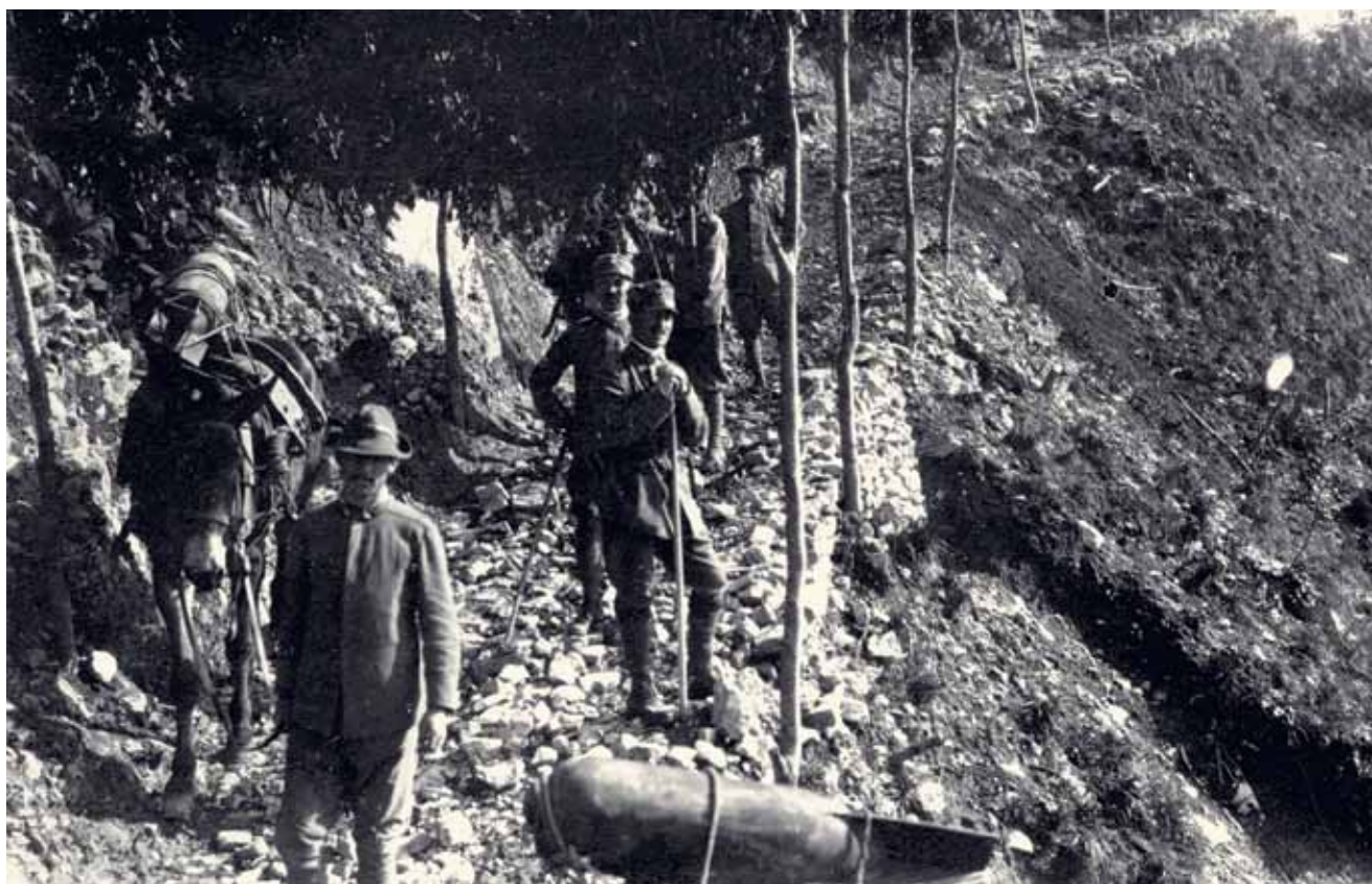
Italijani z mulami tovorijo 240 mm mine na Mrzli vrh.

dobesedno gledala iz oči v oči. Kaverne najdemo tudi na drugi strani hriba, ob poti k planini Lapoč so bile, opremljene s pogradi in drugim improviziranim pohištvo zavetje za ranjene, umirajoče, bolne, premrle in izmučene. Mrzli vrh je vzel na tisoče življenj. Bil je naj-