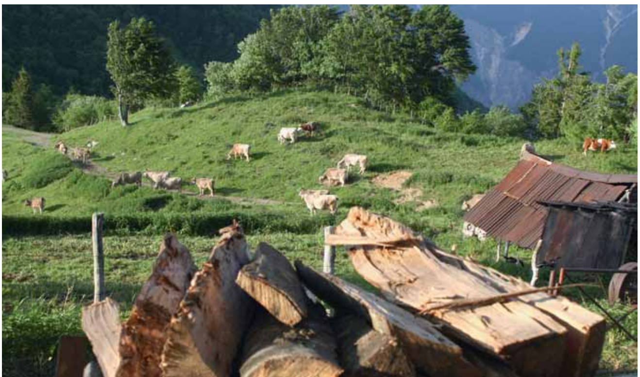
Pod kotli kurijo na drva.

Lapoč je postal hecna planina. Ta prelepi kraj očitno neti umetniško ustvarjalnost lastnikov, ki tod ne pasejo več krav, ampak zgolj junice in ovce. Umetniške instalacije na nekdanjih hlevčkih so sledi časa od poganov dalje. Očesu ne uide poigravanje z najdbami iz prve vojne. To je v Zgornjem Posočju navada, ki je zrasla iz nuje časov po prvi vojni. Vedeti je treba, da je ta vojna ljudem vzela vse premoženje, od trave do živine, od njiv do hiš. Vse je bilo porušeno, požgano, pomendrano, razbito, pokradeno, pojedeno. Ko so se ljudje vrnili v opustelo pokrajino, so morali začeti na novo. S čim? Z vojaških utrdb so pobrali vse, kar se je pobrati dalo. S tem so zgradili nove domove, hleve, vasi in zaselke. Zato so v Zgornjem Posočju stare hiše še vedno krite z zarjavelo valovito pločevino, podprte so z mejniki, tlakovane s ploščami strelskih lin ... Mrzli vrh je bil za časa fronte dobesedno ovit v bodečo žico. Umni živinorejci so z njo ogradili pašnike in tako ustvarili prve žične čredinke v zgodovini posoškega pašništva. In kaj potem? Z Igorjem se napijeva Mrzlice (energetsko bogat izvir na stezi med Lapočem in Pretovčem) in jo mahneva nazaj v dolino. ◦