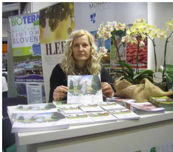
Predstavitev turistične ponudbe v Gradcu