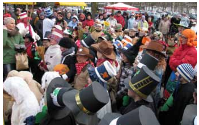
Gneča pod odrom