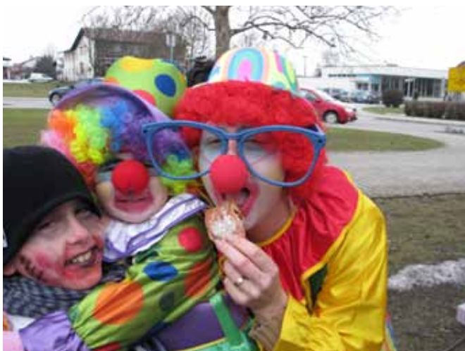
Na pusta gre krof najbolj v slast