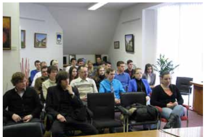
Kar nekaj staršev in sorodnikov je pospremlilo svečani podpis štipendijskih pogodb za letošnje leto