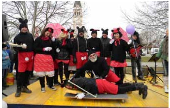
»Miši« (KTD Male rijtar Tešanovci) prikazale, kako se miš ujame v mišelovko