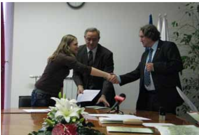
Podpisu pogodbe je sledil čvrsti stisk rok

Pomurska izobraževalna fundacija (PIF) je tudi v študijskem letu 2012/13 v sodelovanju z Občino Moravske Toplice, objavila javni razpis za podelitev štipendij Občine Moravske Toplice za študente s stalnim bivališčem v občini Moravske Toplice. Na osnovi razpisa, objavljenega v občinskem glasilu Lipnica ter na spletni strani občine in PIF dne 08.10.2012, je vlogo za pridobitev štipendije Občine Moravske Toplice posredovalo 36 študentov, od katerih jih je 32 izpolnjevalo vse razpisne pogoje ter jim je bila odobrena štipendija. Skupna višina štipendij za študijsko leto 2012/2013 znaša 35.300,00 evrov. Višina štipendije posameznega štipendista je določena na podlagi seštevka točk, doseženega po naslednjih kriterijih: oddaljenost kraja stalnega prebivališča do kraja izobraževanja, povprečna ocena v preteklem študijskem letu in letnik študija v študijskem letu 2012/2013.