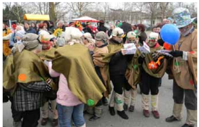
Fokovski osnovnošolci združeni v »gosenico«