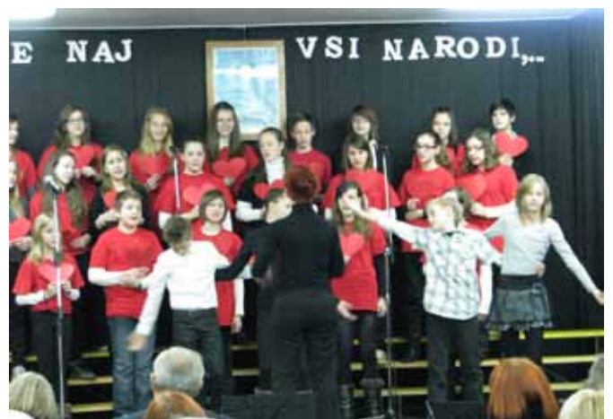
Mladinski pevski zbor OŠ Bogojina je navdušil zbrano občinstvo