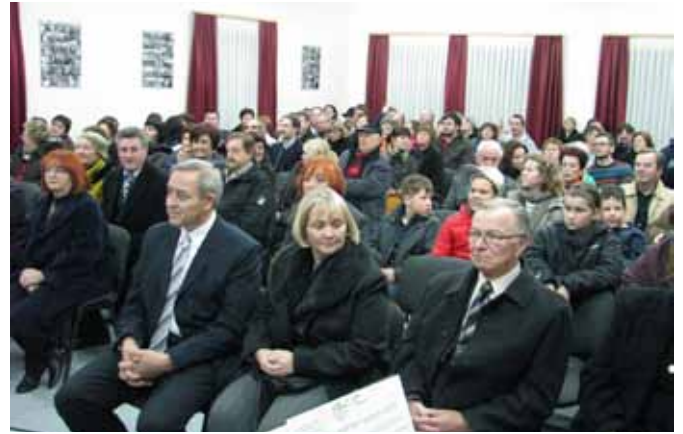
Spominska slovesnost na Prešerna je napolnila dvorano vaško gasilskega doma v Moravskih Toplicah