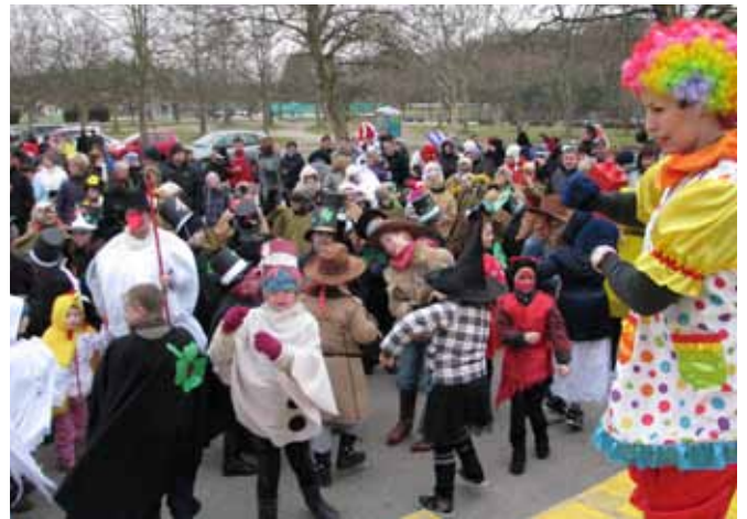
Jocka in Jocka sta poskrbela, da maskam mraz ni prišel do živega

Pustno rajanje na prostem, organizator katerega je enajsto leto zapored bil TIC Moravske Toplice, je minilo v znamenju pisanih barv in prešernega razpoloženja. Za slednje sta s plesnimi vložki poskrbela klovna Jocka in Jocka, z izpraševanjem mask pa je za dobro voljo skrbel dobrodušni vampir, ki je hkrati bil povezovalac programa. Mraz, ki na pustno soboto ni prizanašal, številnim razigranim maskam ni prišel do živega. Mnoge maske se vsako leto rade vračajo na moravskotopliško pustno rajanje, ki ga vedno priredimo na prostem. Tradicija je, da so najlepše maske vedno nagrajene.