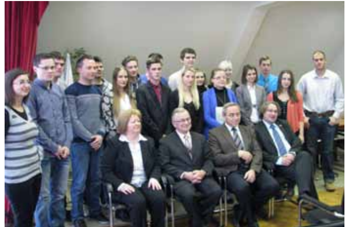
Na koncu še skupinska fotografija študentov in štipenditorjev