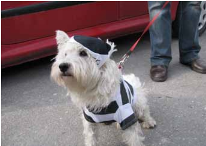
Prijaznega štirinožca je doletela vloga zapornika