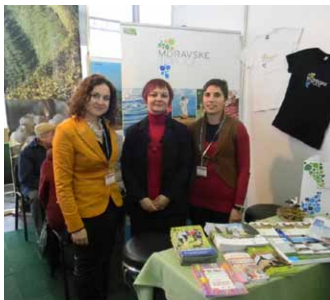
Turistično predstavitev smo na sejmu popestrili z nagradnim vprašanjem, ki se je dotikalo letošnje 50-letnice moravskotopliškega kopalškega turizma.