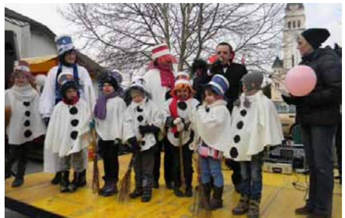
Fokovski osnovnošolci ne preganjali, ampak klicali zimo kot »snežaki«