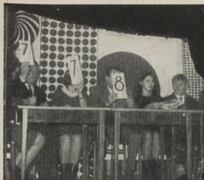
Ocena strokovne komisije