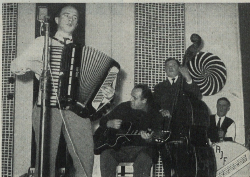
Godbeniki na prireditvi »Pokaži kaj znaš«

Izdaja v 850 izvodih kolektiv tovarne Induplati. Odgovorni urednik Otmar Lipovšek. Natisnila in klišee izdelala Tiskarna »Jože Moškrič« v Ljubljani