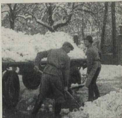
Muhasta je bila lanska jesen

Kvaliteta izdelkov je bila v splošnem nekoliko slabša kot v oktobru.