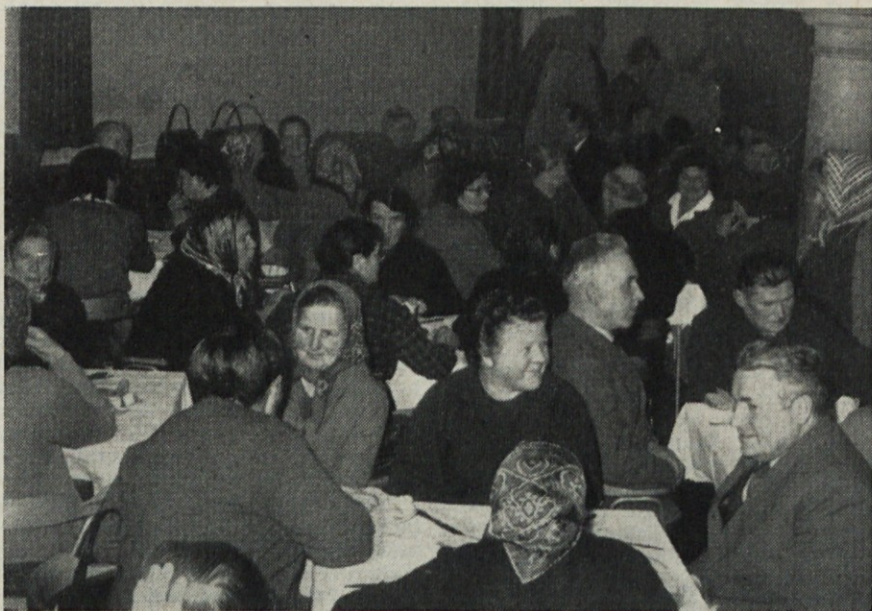
Srečanje starih znancev

Potrebe kažejo, da sedanji osebni avto fiat 1100 za naše podjetje ni dovolj. Upravni odbor je zatoremu sklenil, da predlaga delavskemu svetu v odobritev nakup novega osebnega avtomobila. Verjetno se bodo odločili za avto VW 1500. Cena okoli 40 000 novih dinarjev.