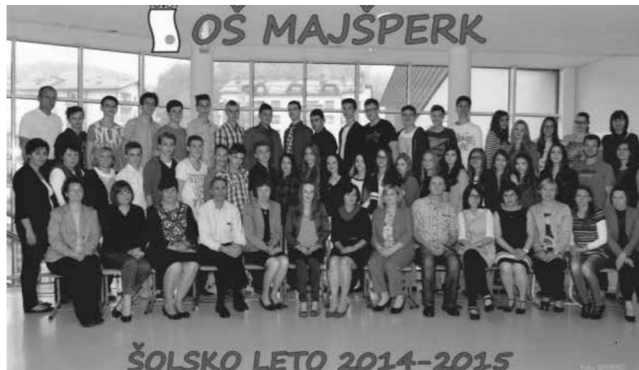
Devetošolci, ki so zaključili obvezno šolanje v šol. l. 2014/2015 na OŠ Majšperk.

Dragi devetošolci, ponosite s seboj vedrino in razposajenost, smisel za pravičnost, sočutnost in odgovornost. Ne hitite, s počasnimi in sigurnimi koraki zapuščate