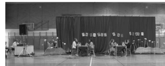
Zabavno in čim bolj smešno