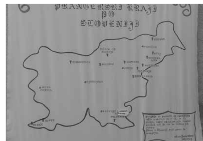
Seznam prangerskih krajev po Sloveniji

Čas je bil, da se odpravimo proti Predgradu, kjer je potekala letošnja Prangerijada in kjer so gostitelji pripravili srednjeveško prireditev. S postavitvijo stojnice smo predstavljali naš kraj, občino Majšperk in seveda naše znamenitosti. Ob prijetnem druženju z ostalimi prangerskimi kraji je prireditev potekala še pozno v večer. Ob zaključku smo si zaželeli le še nasnidenje prihodnje leto v Negovi.