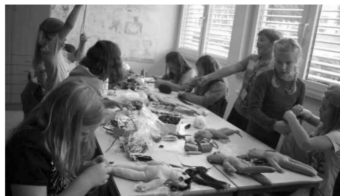
Četrtošolci so se lotili izdelave punčk iz krpic