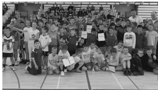
Sodelujoči na zaključnem turnirju KLOŠ-a v OŠ Cirkovce

V okviru ZŽS so učenci in učenke OŠ Majšperk in OŠ Ptujška Gora tako sodelovali v KLOŠ-u. OŠ Ptujška Gora je dosegla 2. mesto in OŠ Majšperk 4. mesto. Otroci so prejeli pokal oz. diplomo o uvrstitvi, majice ter praktične nagrade. Čestitke vsem igralcem za prikazano igro!