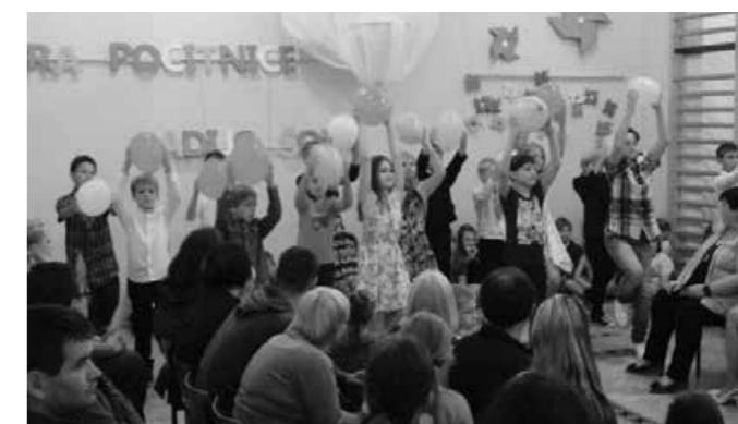
Modna revija s pridihom poletja

Najmlajši so se predstavili v spalnih srajčkih in pižamah, zraven pa seveda niso manjkale niti njihove najljubše igrače,