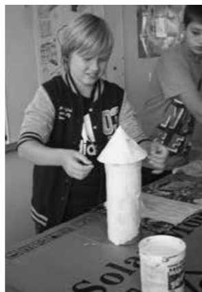
Ali bo uspelo?

-Lahkoten svet - Talumov projekt (sodelovali vsi učenci iz vseh enot). Učenci 4. in 5. razreda so bili nagrajeni v kategoriji učencev 2. triade z ogledom Hiše eksperimentov