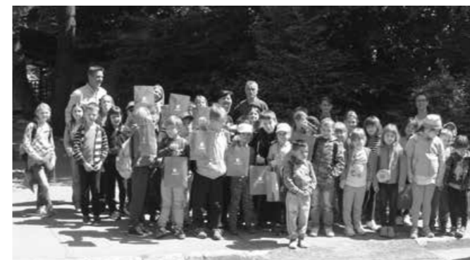
Bili smo tudi v živalskem vrtu!

Kmalu smo prispeli v ljubljanski živalski vrt. Tam smo se razdelili v dve skupini in skupaj z vodnikom odšli v učilnico. Vodnik nam je prinesel malo, tanko, le 3 leta staro igrivo kačo po imenu Kristalka. Je ameriške vrste. Najprej sem se je ustrašila, nato pa smo jo dobili v roke ali okrog vrat. Ko jo je odnesel, je prinesel kunca. Z vodnikom smo nato šli po živalskem vrtu. Pokazal nam je noja in njegovo jajce, žirafe in nam o njih veliko tudi povedal. Potem nam je pokazal opico, ki je najdragocenejša v Evropi. Ogled živalskega vrta smo