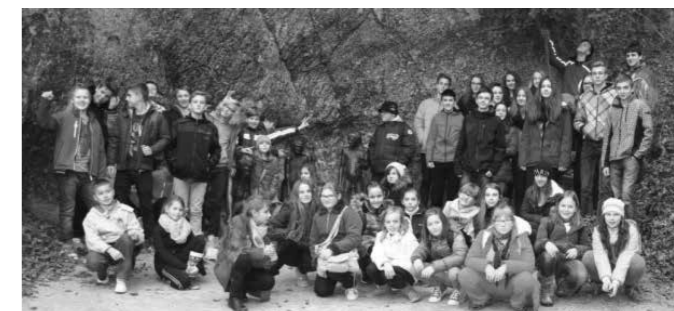
Nadarjeni v Krapini