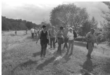
Pohodniki okoli jezera