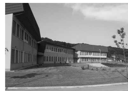
Naše tri lepotic

seženega, naj nam vzbudi željo po novih podvigih, ali pa bo zgolj podoživljanje lepih doživetij in občutij ob omenjenih dejavnostih, tekmovanjih, proslavah, aktivnostih. Na OŠ Majšperk je to leto šolske klopi gulilo 309 učencev. Na enoti Majšperk 249, na enoti Stoperce 18 in na enoti Ptujška Gora 42 učencev. Učni uspeh pa je bil 99,3 %.