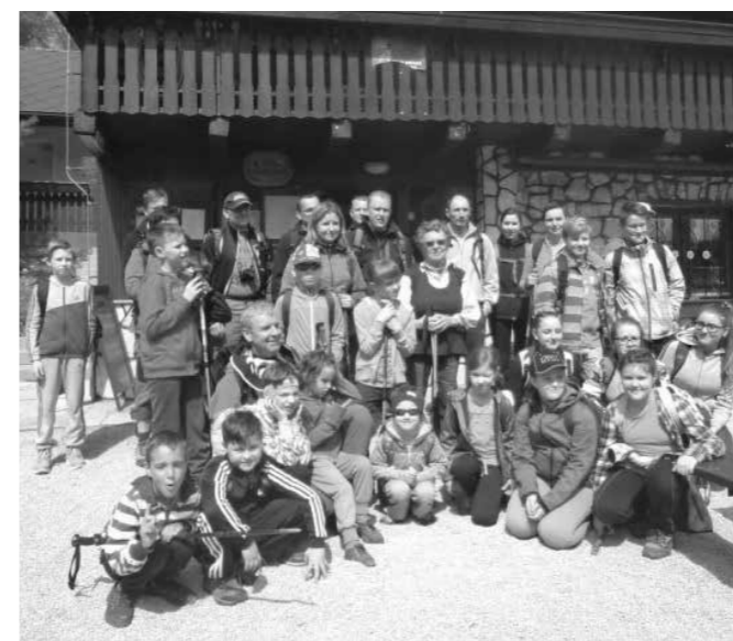
Pohod na Kopitnik