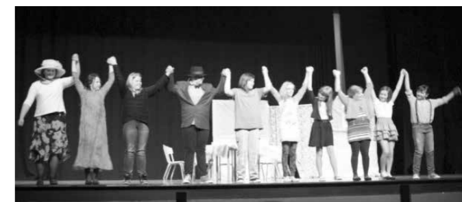
Na odru KPC – sanje so se nam uresničile