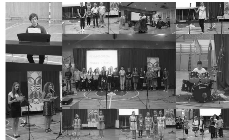
Nekaj svetlih utrinkov naših zvezdic s šolske prireditve