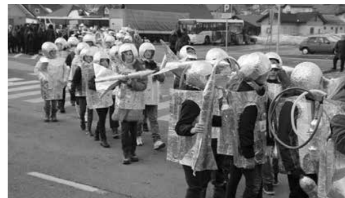
-Pust, rdeča nit: lahkotni svet, vse enote in vsi učenci so se udeležili povorke (astronavti)