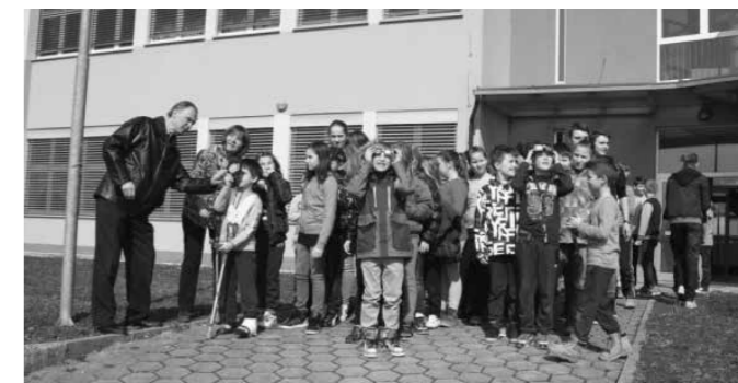
Nadarjeni v Krapini