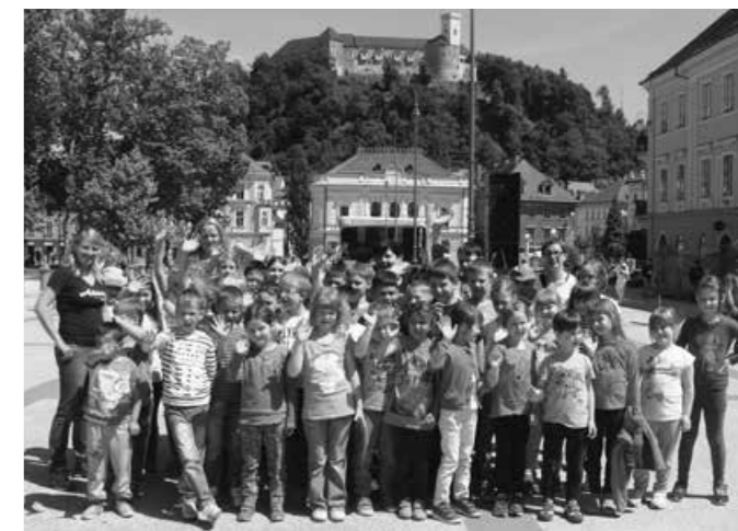
Spomin na potepanje po Ljubljani

V šoli v naravi smo vsak dan plavali. Imeli smo modno revijo, kviz in skeče. Dobila sem srebrnega delfina. Vsak dan smo šli v morje. Z ladjico smo odpluli v Piran. Slikali smo slike in risali kamne. Našli smo veliko školjk. V šoli v naravi mi je