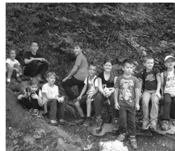
Pohod na Celjsko kočo