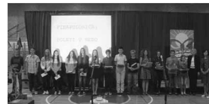
Ob prejemu knjižnih nagrad šole in nagrad občine za uspehe