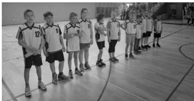
Učenci OŠ Majšperk