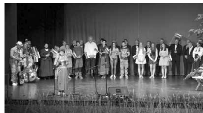
Sodelujoči na prireditvi ob dnevu državnosti