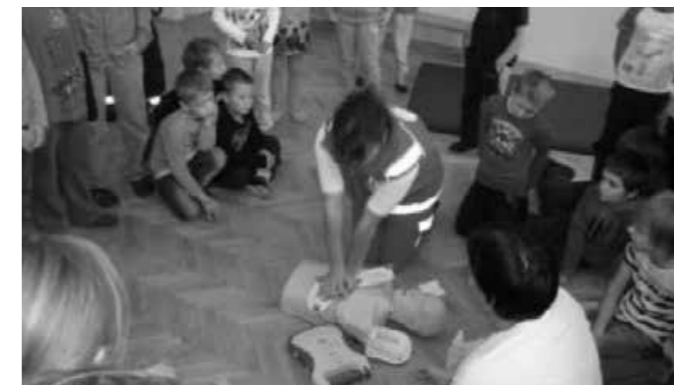
Učenci na Prujski Gori so se poučili o oživiljanju