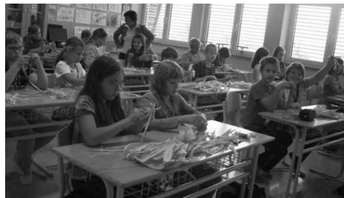
Izdelki iz kozuhovine, kar pa ni tako enostavno

-Lahkoten svet - Talumov projekt (sodelovali vsi učenci iz vseh enot). Učenci 4. in 5. razreda so bili nagrajeni v kategoriji učencev 2. triade z ogledom Hiše eksperimentov