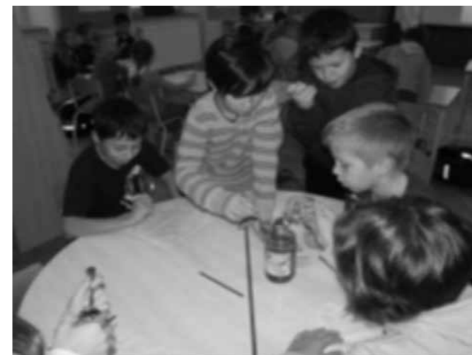
V Stopercih so se sladkali s čebeljim pridelkom