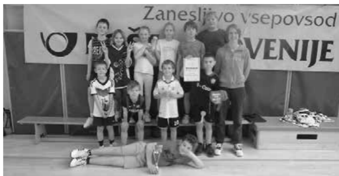
Učenci OŠ Ptujška Gora

Decembra smo na OŠ Majšperk izpeljali tudi medobčinsko tekmovanje mini rokometu. Učenci 4. in 5. razreda so se pomerili z OŠ Ljudski vrt, OŠ Mladika in OŠ Olge Meglič Ptuj. Nekateri učenci so tako dobili prve tekmovalne izkušnje.