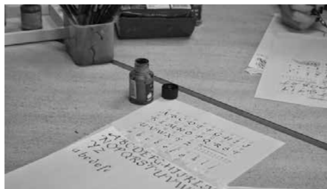
Dobri stari časi in pisava