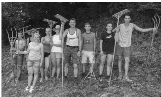
Predsednik Pahor in naš podmladek

In zakaj pišem v Majšperčana, kar se je dogajalo v žetalski občini? Prvi razlog je, da je kar nekaj stoperških in tudi maj-