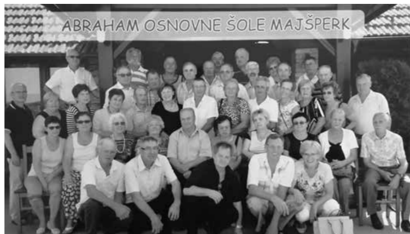
Abrahamovci OŠ Majšperk

Danes ugotavljam, da za naše srečanje niso bile ovira velika