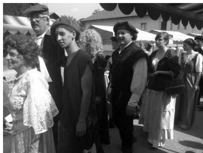
Majšperški gledališčniki pred stojnicami...