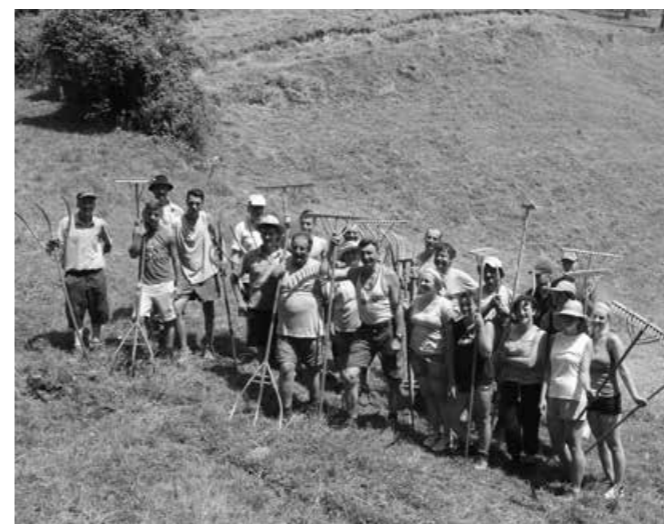
Skupinski posnetek ob zaključenem delu

šperških kmetij včlanjenih v Delavsko društvo hribovskih kmetij. Naslednji razlog je, da smo Stoperčani precej sodelovali pri organizaciji in tudi sami izvedbi tega dogodka. Tako je Stoperška banda poskrbela za prijetno druženje z domačo glasbo; pripravili smo malico, ki smo jo tudi odnesli na hrib; kar nekaj Stoperčanov je pomagalo pri spravilu sena, pa tudi