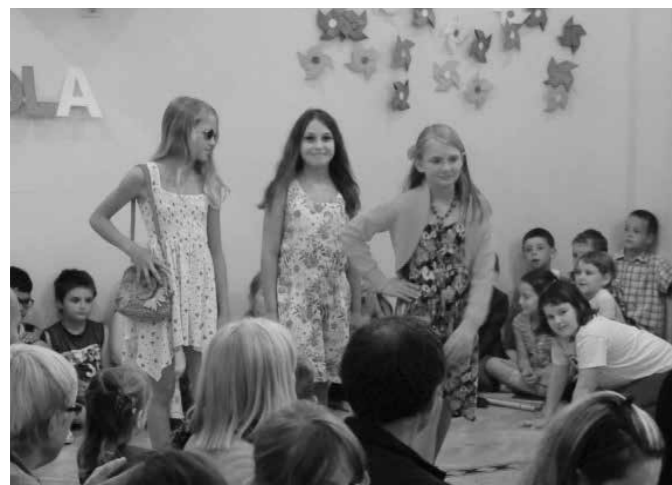
Mlade manekenke iz OŠ Ptujška Gora