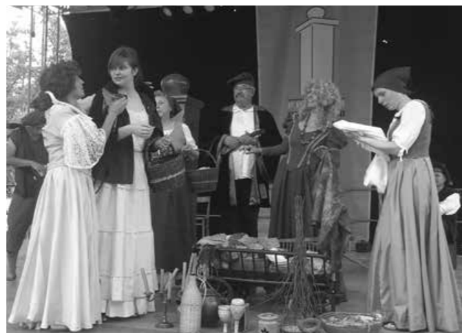
... in na odru

V soboto, 18. julija, nas je tako pot vodila v Predgrad pri Kočevju, kjer je ohranjen eden izmed prangerjev. Člani TD Ptujška Gora so si postavili stojnico, kjer so predstavili, promovirali občino Majšperk s Ptujško Goro, saj je ravno na trgu na Ptujški Gori še ohranjen sramotilni kamen. Člani dramske sekcije UD Ustvarjalec Majšperk pa smo se v srednjeveških oblačilih sprehajali po srednjeveški tržnici in se na odru predstavili z prikazom srednjeveškega sojenja. Tokrat smo sodili in se posmehovali potujočim trgovcem, ki so goljufali uboge vaščane, njihov nagajivi sopotnik je tudi »žeparil« po že tako »suhih« žepih. Igralec na lutnjo ter