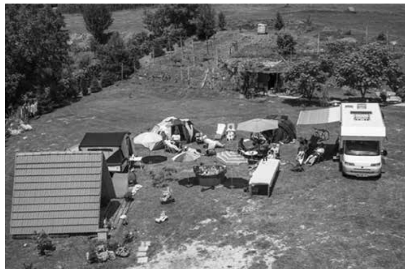
V kampu Tisa je prostora za vse!

nas lepo sprejeli, razkazali okolico in prostor, kjer lahko postavimo šotore. Začeli smo postavljati, vsaka družina svoj šotor. Najlažje je bilo prijateljcem, ki so prišli kar z avtomodom. Nato je sledila večerja in spanje. Naslednji dan smo se kopali, igrali nogomet na travi in ročni nogomet, šli na sprehod, jedli, pili in veliko počivali. In že je bila nedelja, ko je bilo potrebno vse zopet pospraviti in se odpeljati nazaj domov. Domov smo prišli spočiti, polni vtisov in dobre volje. To pomeni, lahko se imaš lepo tudi, če ostaneš v domačem kraju. Prepričajte se sami in se oglasite v kampu Tisa v Majšperku, kjer vas bodo lepo sprejeli, vi pa si boste odpočili v naravi.