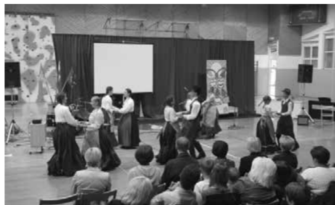
Učenci iz Stoperc nadaljujejo tradicijo