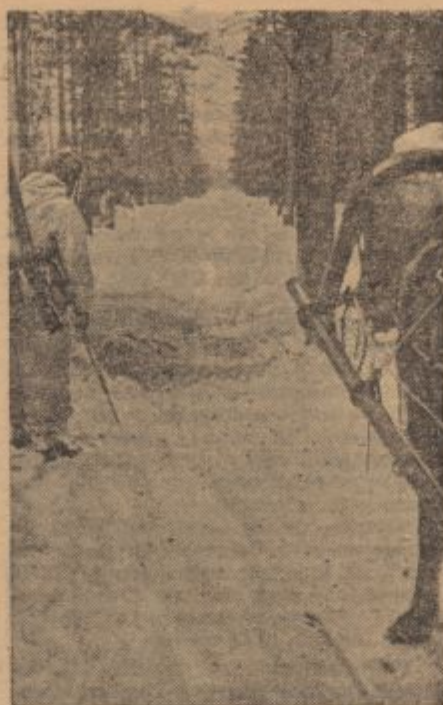
PK.-Kriegsbericht Hensch (Sch)

* Italijanska oborožena sila dobi namestnika šefa generalnega štaba. Ta položaj bo zasedel oficir v stopnji poveljujočega generala in bo pomočnik šefa generalnega štaba, hkrati ga bo pa zastopal, kadar bo radi bolezni, dopusta itd. odsoten. Zastopnik šefa generalnega štaba dobi lasten štab, ki ga bodo sestavljali oficirji vseh treh rodov orožja.