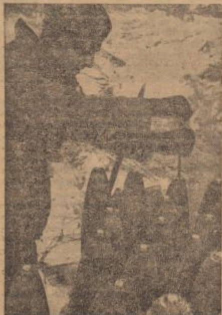
PK.-Kriegsbericht Schürer (Sch)

Allabendlich, wenn sich unsere Soldaten nach einem Spättruppunternehmen irgendwo in der Wüste ein Nachtlager bereiten, ist stets die erste Arbeit: Bettenbau. Jeder schaufelt sich selbst eine Kule im weichen Sand, den jeweiligen Körperformen und Wölbungen angepaßt. Das ganze dann mit Decken belegt, kein Himmelbett vermag damit zu konkurrieren.