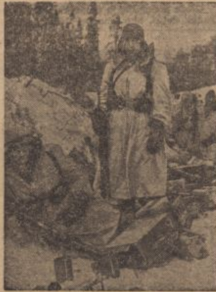
ff-PK-Kriegsbericht Raudies (Sch)

* Samo poklicni fotografi bodo lahko fotografirali. Po najnovejših določilih se bo filme, fotografske plošče in fotografski papir prodajalo samo poklicnim fotografom. Hkrati je prepovedano razvijati in kopirati filme in plošče za nepoklicne svrhe.