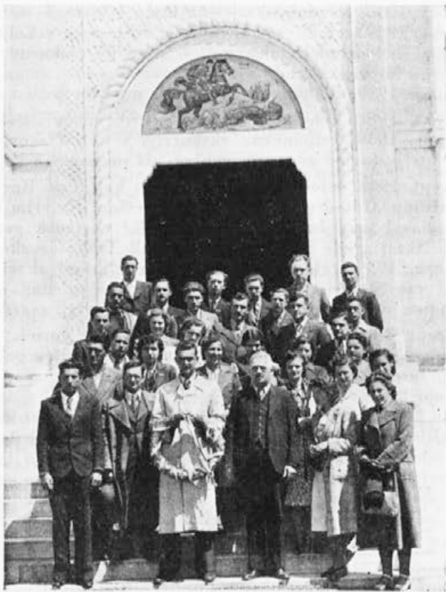
Maturanti na Oplencu.