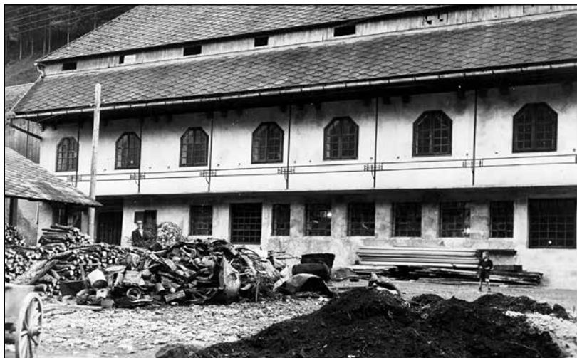
Johanov hlev pred obnovitvijo.

Ko se je 27. aprila 1946 na pobudo Nika Žumra ustanovila zadruga z imenom Niko, proizvodna zadruga kovinarjev, z. o. j., je bil med ustanovnimi člani. Bil prvi delavec kovinar, ki je v prostem času še pred odprtjem delavnice čistil in urejal zapuščene stroje ter s tem vložil prvo prostovoljno delo za novoustanovljeno zadrugo.