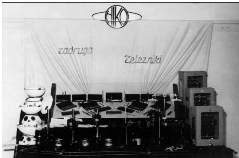
Proizvodi zadruga Niko, z. o. j.

Vrednost dodeljenih osnovnih sredstev je bila 72 mio dinarjev, od tega samo elektrarne 56 mio dinarjev, le 16 mio pa ostale proizvodne opreme, ki je bila v veliki meri že amortizirana. Obratna sredstva je Iskra – tovarna elektromotorjev Železniki odprodala na kratkoročni kredit, ki je moral biti odplačan v pol leta.