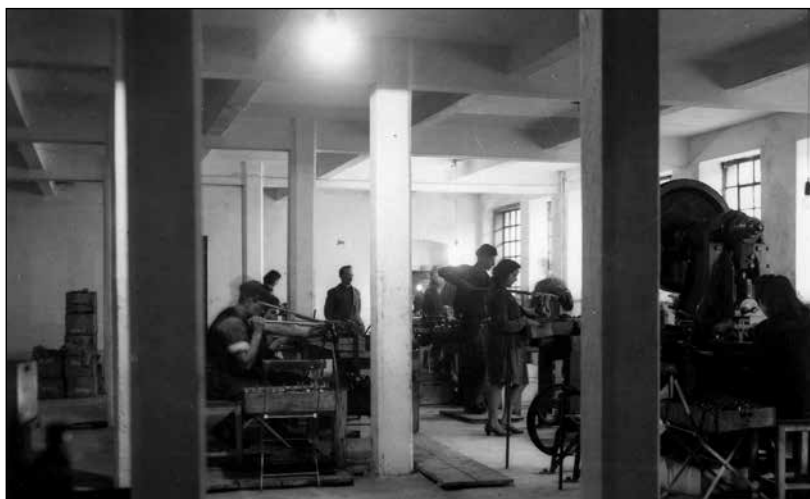
Obnovljeni prostori v Johanovem hlevu.