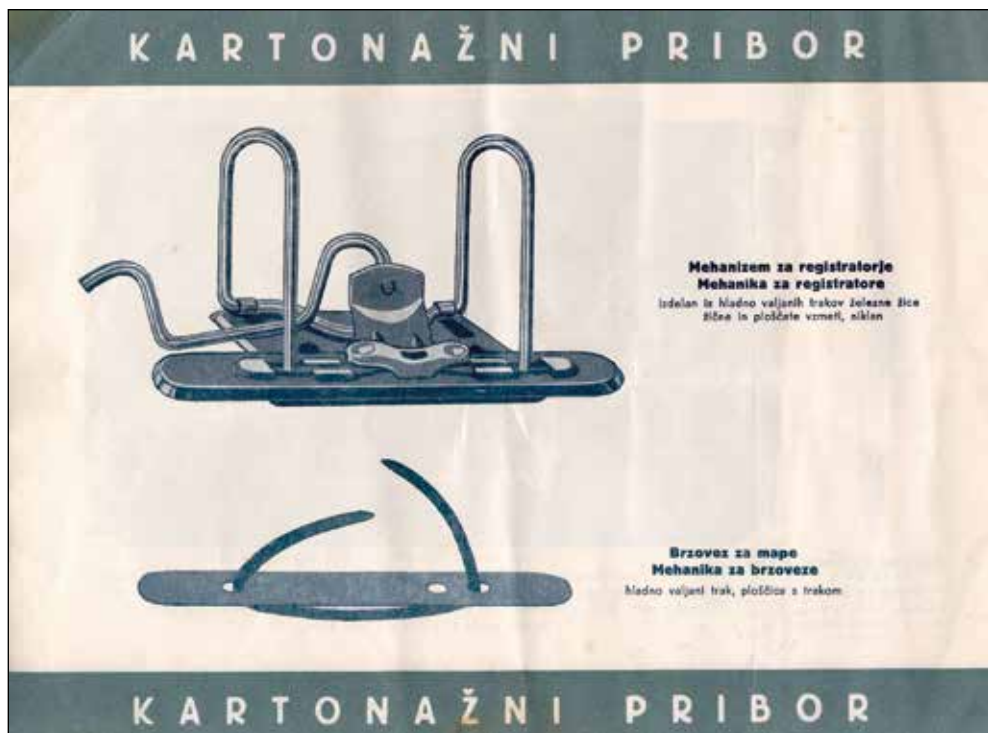
Prospekt zadruga Niko, z. o. j.