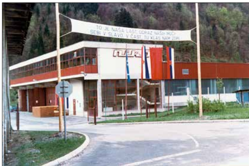
Otvoritev novih prostorov v Otokih 1977.

Z odprtjem novih prostorov in pridobitvijo modernejših tehnologij se je torej pod Petrovim vodstvom začel nov razvoj podjetja Niko, ki pa je bil leta 1987 nasilno prekinjen. Peter je bil na neposloven,