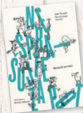
Odrasli oddelek Potopisi Tomazič, Agata; Langus, Tamara; Kleč, Teja: Ne sprašujte za pot – blodnik po Istri Društvo za dolgozeženje, 2019

Viri: www.emka.si , www.bukla.si , www.dobreknjige.si