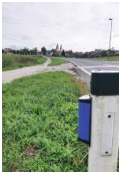
Modri odsevník, nameščen na obcestnem stebričku

Skupaj z naraščanjem števila vozil v prometu se zvišuje verjetnost povoza divjadi. Za preprečevanje trka divjadi z vozili se v praksi uporablja zvočna odvratača, kemična ter svetlobna – signalna odvratača.