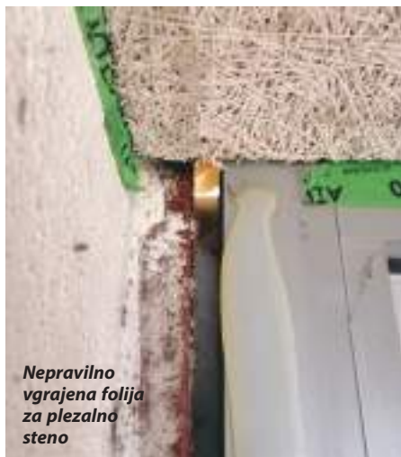
Nepravilno vgrajena folija za plezalno steno

Preko poletja in v jeseni smo urejali športno infrastrukturo. Igrišče Dvorska vas je opremljeno z dvema novima košema za košarko, prav tako so svoj koš dobili vaščani Mohorij. Zagotovo največji zalogaj, tako po obsegu del kot finančno, pa je bila energetska sanacija športne dvorane pri OŠ Primoža Trubarja Velike Lašče. Glavni cilj investicije je bil preprečitev nastajanja kondenza in posledično zatekanja vode v dvorano ter znižanje toplotnih izgub in posledično stroškov ogrevanja.