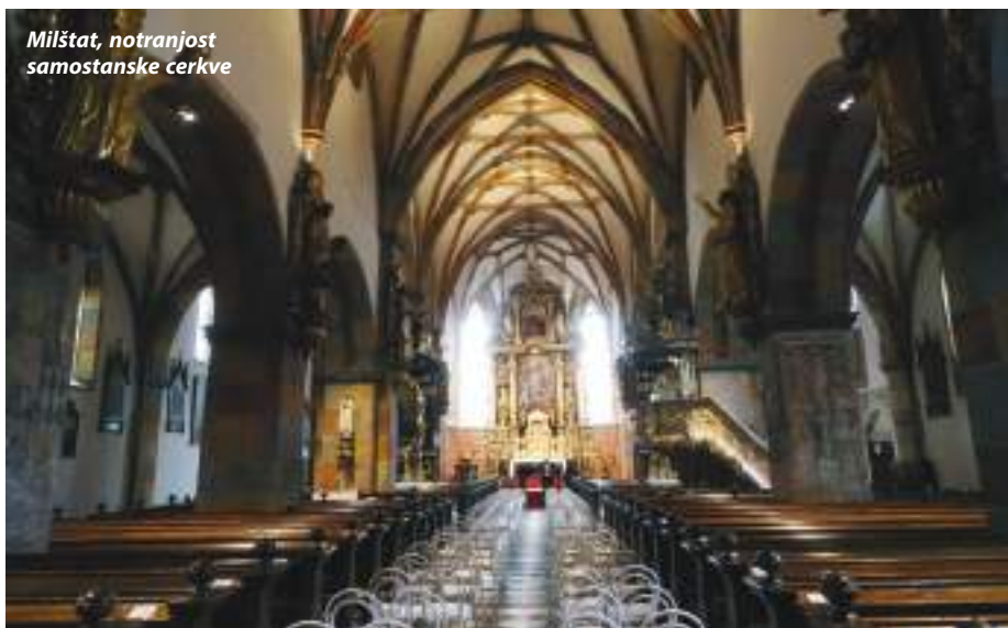
Milštat, notranjost samostanske cerkve

Avstrijska Koroška z mnogimi jezeri je bila vedno lepa, urejena, čista in malo naša. Vendar jo mi celinci premalo poznamo. Zato smo bili veseli, da nam jo je predstavil dober vodič, ki je bil tam skoraj doma. Poznal je vsako stezico in vasico, imel je veliko umetnostnozgodovinskega znanja in nam je predstavil tudi vse njihove aktualne politične ter druge probleme današnjih dni. Bil je zagotovilo za izvrsten izlet in pod naslovom Lepote Koroških jezer smo, posebno tisti, ki smo dobro poslušali, spoznali res veliko zanimivosti. Pot nas je vodila takole: