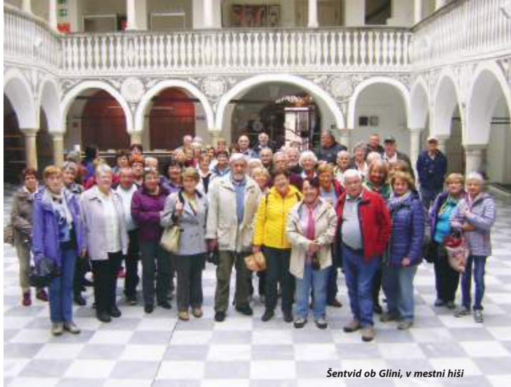
Šentvid ob Glini, v mestni hiši

Helena Grebenc Gruden