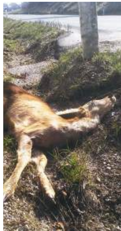
Zaradi prometa izgubljen mladič srnjadi

V mesecu oktobru je bil izpeljal projekt nameščanja modrih odsevnikov tudi na območju našega lovišča. Odsevníki so bili nameščeni na osmih odsekih državnih cest, kjer je frekvenca povoza skozi leta najvišja. Modri odsevníki delujejo tako, da žarometi vozila osvetlijo odsevník, ki modro svetlobo meče pravokotno od vozišča. Uporablja se modra barva, saj so raziskave pokazale, da je ta za divjad najbolj moteča. Odsevníke so drugod po državi nameščali že pred časom. Uspešnost tovrstne metode je lahko tudi do 70-odstotna.