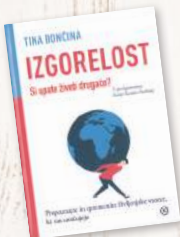
Odrasli oddelek Psihologija Bončina, Tina: Izgorelost – si upate živeti drugače? (prepoznajte in spremenite življenjske vzorce, ki vas uničujejo) Mladinska knjiga, 2019

V mestu, kjer so vsi videti isti, želi biti samosvoj mož s kratkimi lasmi tak kot vsi drugi. A le dokler ne ugotovi, da je biti to, kar si, veliko zabavneje. Poživljajoča zgodba, ki spodbuja k individualnosti, podvomi v prilagodljivost in privzgaja pogum. Otroke uči, da bi bil svet zelo dolgočasen ter neizrazit brez posameznikov in njihovih posebnosti.