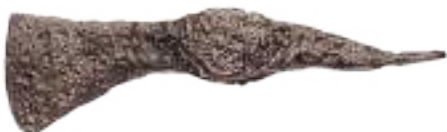
Gradiški vrh nad Robom, halštatska sekira skitskega tipa – verjetno najstarejši predmet v naši občini. Danes je shranjen v Narodnem muzeju v Ljubljani.

Današnja Slovenija in z njo Lašče z okolico je dobila gostejšo poselitev s prihodom trakokimerijskega ljudstva (Iliri) okrog leta 760 pred našim štetjem. O zgodovinskih dogodkih nam poročajo pisni viri – to je zgodovina. Tam, kjer imamo samo materialne vire (temelji stavb in obzidij, orožje, lončenino in druge predmete), pa gre za prazgodovino.