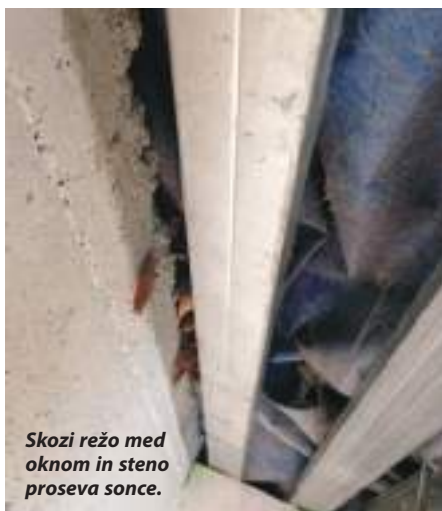
Skozi režo med oknom in steno proseva sonce.

V avgustu in septembru je bila izvedena prva faza sanacije, in sicer odprava napak v tesnenju – popravilo parnih zapor (manjkajoče ali nespojene) in dopolnitev izolacije na manjkajočih mestih.