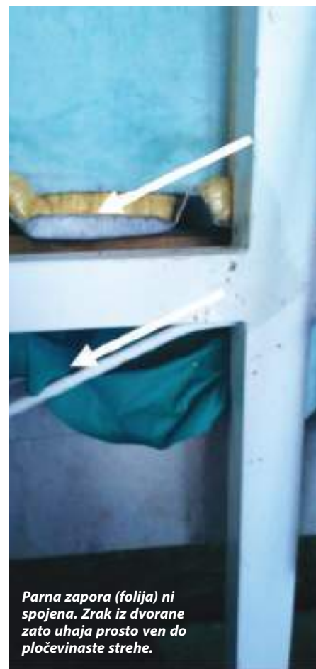
Parna zapora (folija) ni spojena. Zrak iz dvorane zato uhaja prosto ven do pločevinaste strehe.

Vsa velika okna je bilo treba zatesniti s tesnilno peno purpen in s tesnilnimi masami med okni. Zamenjali so tudi vrata stranskega vhoda. Zaradi obsežnosti investicije je druga faza izolacija klimata – predvidena za naslednje leto.