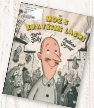
Mladinski oddelek Slikanje Jolly, Jane: Mož s kratkimi lasmi Skrivnost, 2019

V mestu, kjer so vsi videti isti, želi biti samosvoj mož s kratkimi lasmi tak kot vsi drugi. A le dokler ne ugotovi, da je biti to, kar si, veliko zabavneje. Poživljajoča zgodba, ki spodbuja k individualnosti, podvomi v prilagodljivost in privzgaja pogum. Otroke uči, da bi bil svet zelo dolgočasen ter neizrazit brez posameznikov in njihovih posebnosti.