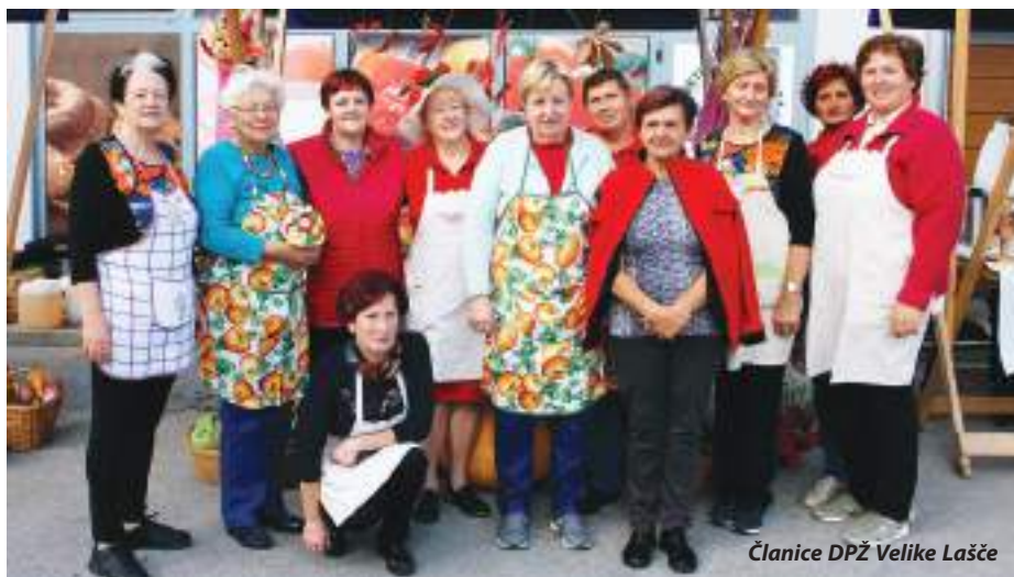
Članice DPŽ Velike Lašče

Že 17 let zaporedoma vsako leto v začetku oktobra članice Društva podeželskih žena Velike Lašče izvedejo jesensko prireditev, ki so jo prvotno imenovala Bučarijada, kasneje pa Bučno-marmeladni dan. Namen je ostal enak: predstaviti pridelke, ki jih članice zasadijo pomladi in pobirajo poleti ter vse do jeseni, dati v pokušino najrazličnejše sladke in slane jedi iz njih ter svoje recepte in izkušnje s tem prenesti tudi na mlade rodove.