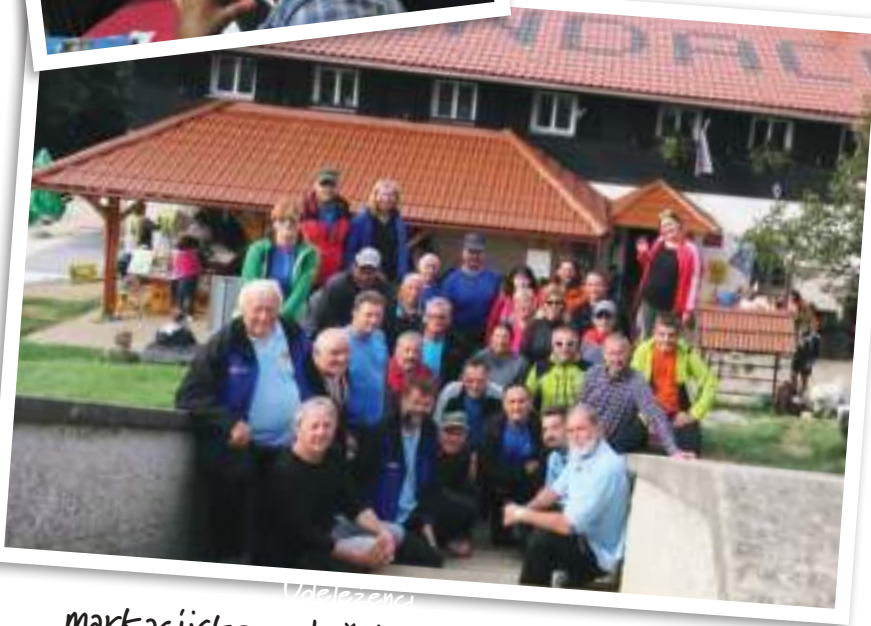
Valezevci markacijskega tečaja na gori Oljki