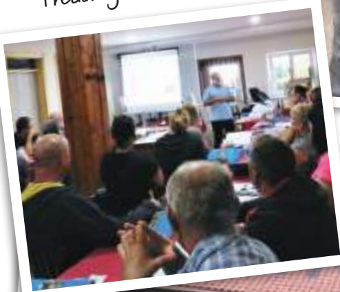
Predavanje na tečaju