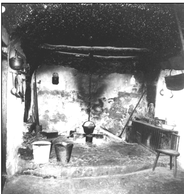
Črna kuhinja pri Šergali na Kovku.

bile vse enake, krite s slamo, razen dveh erarskih na Predmeji, in župnišča na Otlici, te zadnje so bile krite z opeko. Vse hiše so bile enako razdeljene in rekel bi, skoraj slične. V hišo se pride skozi glavna vrata v kuhinjo. Tam je na tleh gorel ogenj, iz kuhinje se je prišlo levo in desno v sobo. 20 Ognjišče v hiši na Kovku pri Šergali, ki je stalo še dobrih deset let nazaj, je bilo na tleh, prislono na zadnjo steno in brez dimnika. Dim se je prosto valil pod steno oz. obok, mimo "glistnc", na katerih se je sušilo meso.