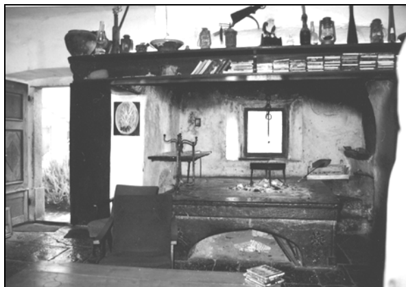
Ognjišče v hiši v Batujah (Foto: Andrejka Ščukovt, 2000).