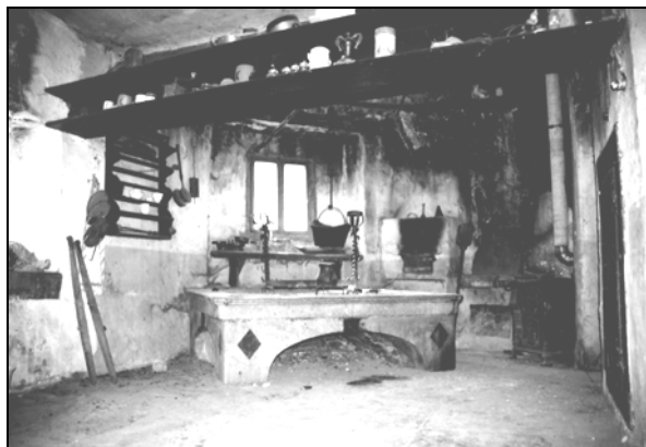
Kuhinja z visokim ognjiščem in napo ter dvema pečema za peko kruha in potice na Gočah.

vedno odprto ognjišče, so na vrhu zaprli z obokom oz. napo, iz katere so speljali visok in umetelno oblikovan dimnik. Sčasoma se ustvarijo še novi pogoji za nadaljnji razvoj ognjišča. Ognjišče v spahnjenci ali v hiši obvladuje skoraj ves prostor. Je že višje, do okrog \frac{3}{4} metra in predvsem ni več masivno grajeno. Ognjišče je pozidano iz klesane kamna, ki ga je izdelal več kamnosek. Čeprav so ognjišča kamnita, praviloma niso likovno oblikovana. Le redka imajo okrašeno prednjo stranico. Pogosto je to izklesan plitek relief, ki lahko predstavlja rastlinski ali geometrijski motiv. Slednji je največkrat v obliki romba, lahko ima še sveti monogram IHS. Zelo redka ognjišča imajo letnico. Poleg opisanega imajo ognjišča na prednji strani tudi polkrožen ali pravokoten izsek, da je gospodinja laže obvladovala ognjišče. Izsek je služil tudi za spravilo drvi.