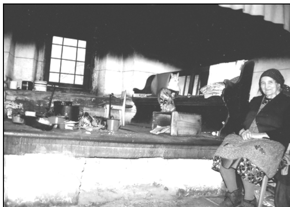
Ognjišče pri Dolenjih Stajčerjevih v Lozicah pri Podnanosu, na katerem še vedno kuhajo (Foto: Andrejka Ščukovt, 2002).

Ognjišča so se najdlje ohranila v sredozemskem kulturnem prostoru in v glavnem propadla s hi- šami vred. 3 V želji po modernizaciji in izboljšanju bivalnih razmer, da bi torej pozabili na "težke čase", so se ognjišča že pred več kot petdesetimi leti umaknila sodobnim kuhinjam in stavbam. 4 Kljub temu si je možno v nekaterih vaseh oz. hišah v Vipavski dolini, ogledati še ohranjena og- njišča. V dveh primerih na ognjišču še vedno kuhajo. Čeprav gre samo za dva taka primera, je to za današnje razmere izjemna redkost. Tudi zato, ker prasketajoči ogenj povzroča dim, ki se pra-