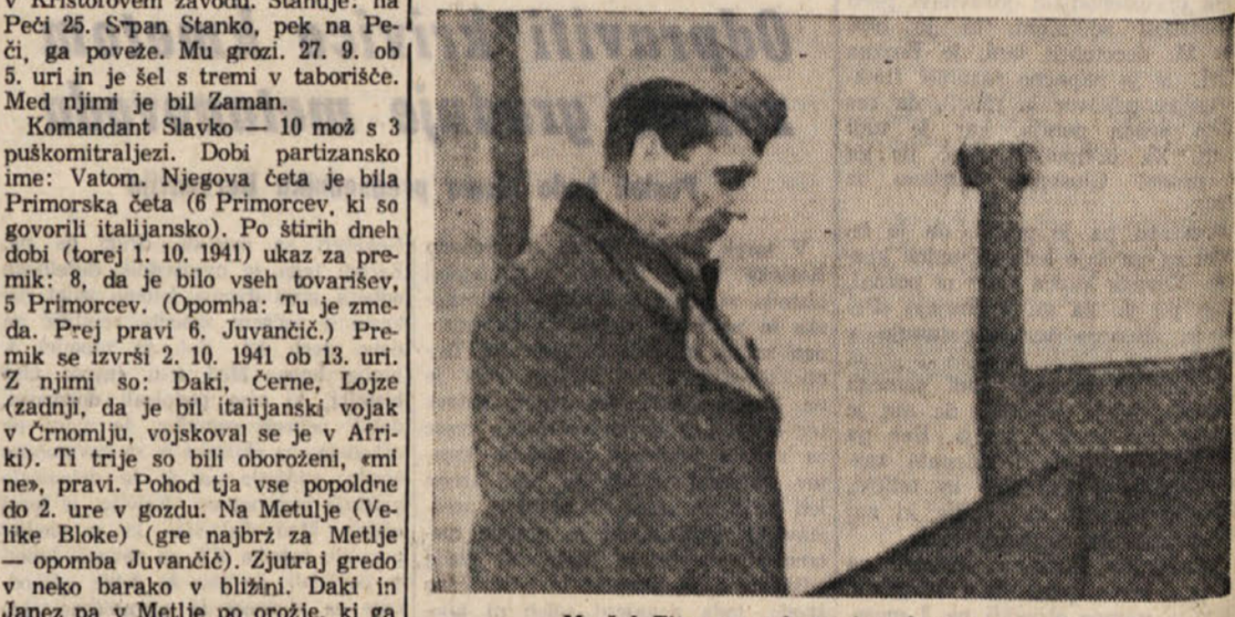
Maršal Tito v revoluciji jugoslovanskih narodov