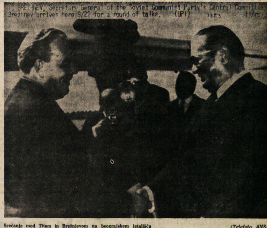
Srečanje med Titom in Brežnjevom na beograjskem letališču

V nadaljevanju svoje zdravice je Tito opozoril na nevarna žarišča na svetu, na zapletena gibanja v mednarodnih političnih in gospodarskih odnosih in ugotovil, da je predvsem od aktivnosti miroljubnih naprednih sil odvisno, v katero smer se bodo razvijali mednarodni odnosi. Brežnjev je na začetku svoje zdravice izjavil, da se je v zdravici Tita odražal duh prijateljstva in bratstva, ki povezuje obe državi, in da je dolžnost partijskih in državnih voditeljev obeh držav, da te občutke konkretno izražajo v izjavah in konkretnem sodelovanju med Sovjetsko zvezo in Jugoslavijo. Smisel sedanjih razgovorov, je dejal Brežnjev, je, da se skupno določajo pota nadaljnjih odnosov med obema partijama in državam in da se preučujejo aktualna mednarodna vprašanja. Po mišljenju Brežnjeva ta naloga ni enostavna, ker še vedno prihaja od izraza dediščina iz let, ko so bili skajleni odnosi med obema državama. Toda, je poudaril Brežnjev, ne bi bili komunisti, ne bi bili internacionalisti, če se ne bi uspešno dvignili nad preteklost, in če ne bi videli širokega obzora današnje dobe, če ne bi doumeli, da je naša skupna odgovornost v skupni borbi za mir in socializem. Brežnjev je ugotovil, da narode obeh držav od zdavnaj vezeljo trdne vezi velikega in dobrega iskrenega prijateljstva, ki so se še bolj utrdile v skupni protifašistični borbi.