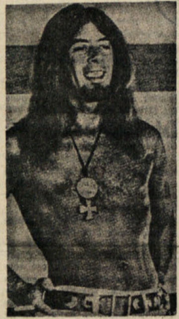
Angleškemu pevcu Johnu Mayallu prava gotovo ne bi prisodil 38 let...

KAIRO, 22. — Egiptovska vlada pripravila proslavo ob prvi obletnici Naserjeve smrti, to je 28. septembra. Tudi druge ustanove so pripravile slovesnosti v cast umrlemu državniku. Med temi je tudi sovjetsko veleposlanstvo v Kai-