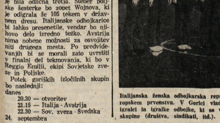
Italijanska ženska odbojarska reprezentanca (na sliki) se je že od sobote pripravljala na svoj nastop na evropskem prvenstvu. V Gorici vlada za to priveditve veliko zanimanje. Tekme bodo v dvorani UGG. Vsi igralci in igralke odbojke, ki so vključeni v FIPAV, imajo pri nabavi vstopne popust, prav tako kot tudi skupine (društva, sindikati, itd.). Rezervacije sprejemajo na tajništvo prvenstva v Gorici, Largo Cullat 2

Potek ženskih izločilnih skupin bo naslednji: 20.30 - otvoritev 21.15 - Italija - Avstrija 22.30 - Sov. zveza - Švedska 24. septembra