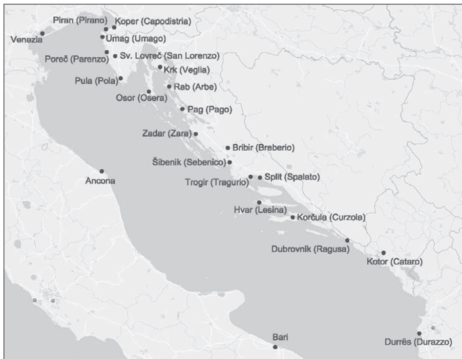
Slika 1: Karta istočnog Jadrana (izradila: Ivana Haničar Buljan).

se također nazivaju potestatima kao i kasniji mletački dužnosnici), kao što je primjer Varnerija de Gillaca (Pusterla, 1891, 8; Morteani, 1886, 326). 9 Venecija je utjecaj na istarske gradove imala i preko trgovačkih ugovora potpisanih još u 12. stoljeću - s Koprom, 10 Rovinjom, Porečom, Novigradom, Umagom, kao uostalom i s nekim talijanskim gradovima iz regije (Hoquet, 2012; Miller, 2007, 52; Darovec, 2020, 655–688; Vergottini, 1949, 87–104).