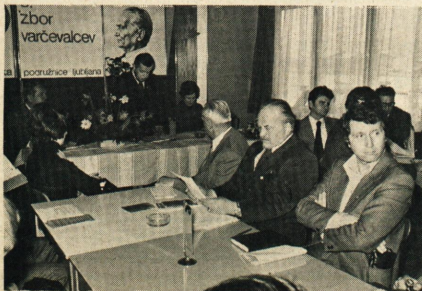
S 3. zbora varčevalcev LB, ki je bil 31. 3. v Litiji

Pismene prijave za najem prostorov pošljite najkasneje do 30. aprila 1977.