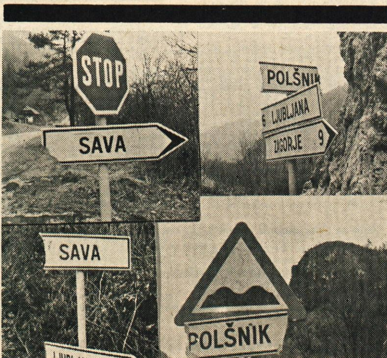
PA SE ZNAJDI...