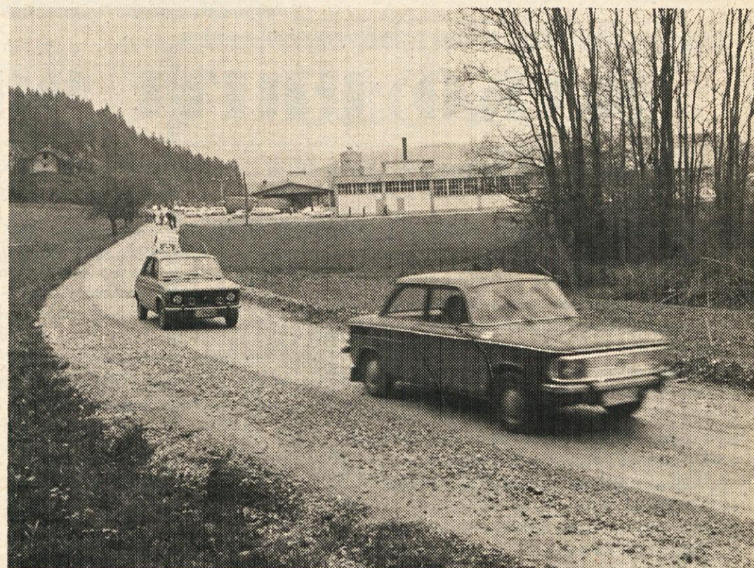
Odslej „Zagorica“