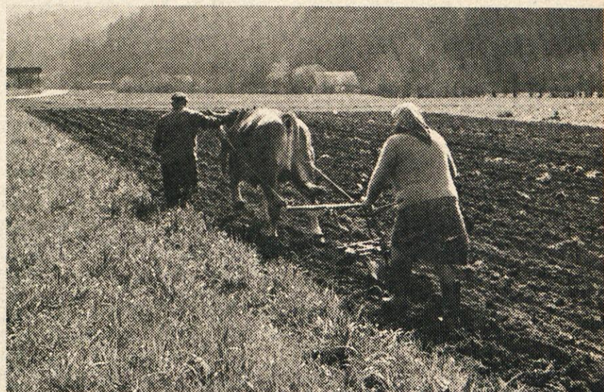
Takšne obdelane zemlje je čedalje manj

Lahko zaključimo, da kmete danes močno sili ekonomska nuja k razmišljanju o nadaljnjem razvoju in nemalokrat tudi obstoju njihovih kmetij. Treba se bo pogovoriti s sosedi in imeti veliko razumevanja za medsebojne sosedske odnose, ki so pravzaprav v sedanjem trenutku edina negotovost v naših razmišljanjih. V zadrugi vam bomo vedno v pomoč pri organizaciji take skupnosti, kadar si boste to želeli.