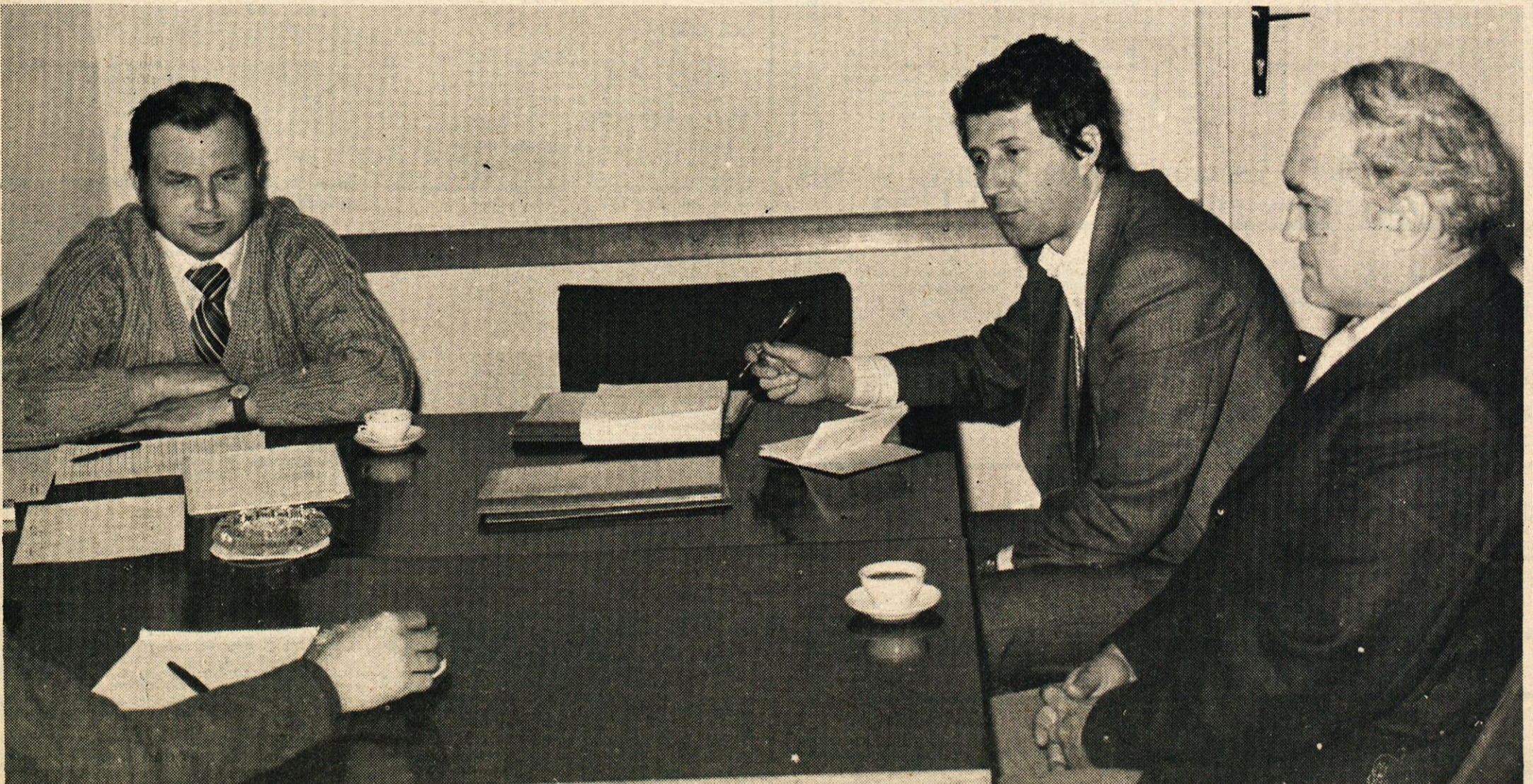
Ekipa, ki je odgovarjala občanom je imela veliko dela

Po istih kot za družbeno stanovanja, to je za 30 % na sedanjo stanarino, in sicer od 1/7-1977 dalje.