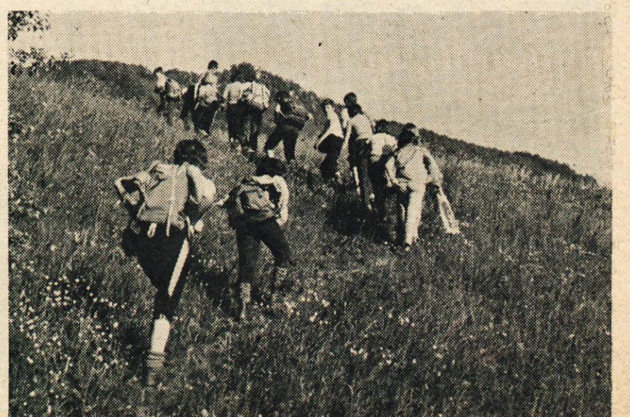
Čim večkrat v naravo