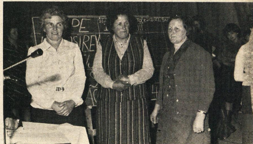
S tekmovanja kmečkih žena o higijenskem pridelovanju mleka ekipa iz Kostrevnice