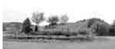
Lepo zasajena zelenica na krožišču.

K rožišča s krožnim prometom do-dobra umirjajo promet. Če so še lepo zasajena z zelenjem, rožami in grmovnicami, pa še pomirjajo voznike in prispevajo k lepšemu videzu kraja.