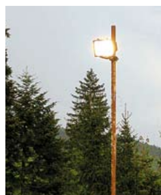
Luč sveti podnevi.

Naj se ve, da se cene električne energije znižujejo.