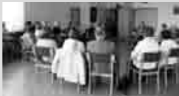
Srečali so se literati-seniorji.