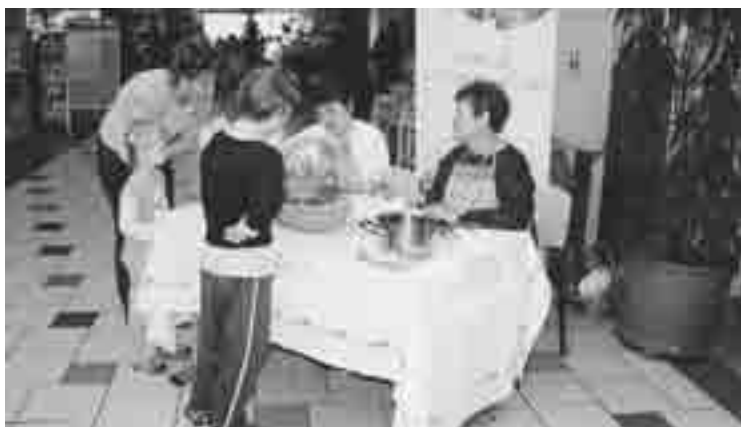
Najbolj zvedavi so dobili v dar okrašene pirhe.

V elika noč je tudi čas barvanja pirhov, ki vernim simbolizirajo plodnost in življenje, mnogim pa na tak ali drugačen način praznični čas le popestrijo, gospodinjam pa so lepo obarvani pirhi že od nekdaj v ponos. Tako so iznajdljive gospodinje sčasoma razvile različne tehnike barvanja pirhov., ki jih industrijske barve in sličice le ne morejo povsem izriniti.