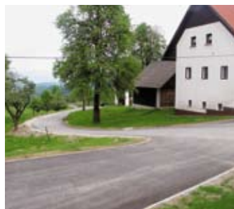
Po asfaltu iz Podlpe v Podpesek.

Posodobljenih je nekaj nad 700 m lokalne ceste iz Podlpe v Podpesek. Ovinkasti klanec je bil prepotreben posodobitve, saj je ob vsakem večjem deževju odnašalo precejšnje dele cestišča in ogrožalo prometno varnost. Investicijska vrednost 150.000 evrov je poplačala družbi Treven, d.o.o. za izvedbo zemeljskih del in ajdovskemu Primorju za asfaltiranje ceste.