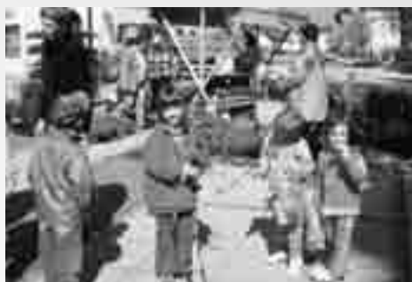
Sredi cvetlične tržnice.

S ončna sobota, 25. aprila, je na ulice Logatca, predvsem pa na trg pred cerkvijo sv. Nikolaja, privabila številne obiskovalce iz bližje in daljne okolice.