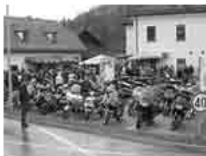
Z blagoslovom na pot.

N a povabilo Motorističnega kluba Notranjska se je do poldne kljub oblačnemu vremenu zbralo precej motoristov iz Logatca in drugih krajev Notranjske. »Naš« Robi je najprej vzel v roke kitaro, brez katere ne gre nikamor, in zapel veselo Alelujo (srečanje je bilo prvo nedeljo po veliki noči). Potem je