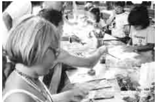
S počitniških dejavnosti.

Projekti, ki smo jih zaključevali tako, da smo rezultate dela predstavili tudi občanom, so potekali tako, da smo izvedbo projekta vedno pričeli v sodelovanju s šolami in vrtci ali pa so se izobraževalne vsebine najprej odvijale v naših izobraževalnih in ustvarjalnih delavnicah, temu pa je sledila javna predstavitev dela na razstavah, sejmih ipd. Izrazito izobraževalna sta bila Miklavžev sejem in Cvetlična tržnica. Ves čas smo si prizadevali, da sejem ni postal tržnica s prodajo oblek, krem, nogavic..., ampak da je omogočal prikaz ustvarjalnosti otrok v naših, šolskih in vrtčevskih delavnicah. Cvetlične tržnice smo posvečali predvsem dnevu Zemlje. Spremljali so jih projekti spoznavanja zelišč, čajev, izdelovanja igračk iz odpadnega materiala, čistilne akcije otrok, izobraževalne otroške predstave na dvorišču pred šolo, predstavitev problematike učinkovite rabe energije in alternativnih virov energije, prva leta izdelovanje maket iz cvetja in sadik. Prodaja rož – komercialni vidik vrtnarjev in cvetličarjev – je bil v »drugem planu«. Želimo si, da projekt, ki ga bo verjetno v bodoče izvajalo Turistično društvo Logatec, obdrži to osnovno poslanstvo. Kot tržnica so bili vsi projekti povezani z otroško ustvarjalnostjo in so v sebi nosili vzgojno izobraževalno noto. Žal, je o tem bilo v lokalnih medijih napisanega zelo malo. Sami se poleg vsega dela nismo videli tudi v vlogi medijskega poročevalca o svojem delu. – Aktivno se je