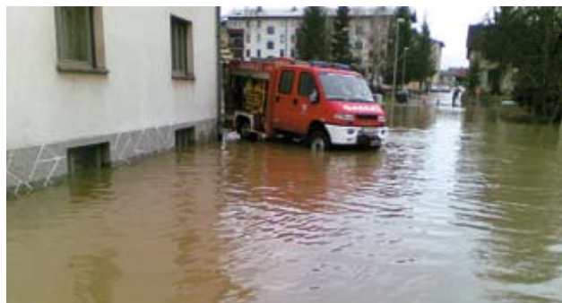
Boj z vodo pri Nagodetovih

Med drugimi vzroki poplav velja omeniti tudi stalno erozijo zemlje v požiralnik Jačka ter plaz, ki se je sprožil tik nad požiralnikom junija 2008. Tudi nesnaga (plastika...), ki jo človek odlaga v strugo, nevarno maši požiralnike. Glede navedene problematike sem že večkrat pisno obveščal Ministrstvo za okolje in prostor ter tudi občinsko upravo in opozarjal, da bi bilo treba