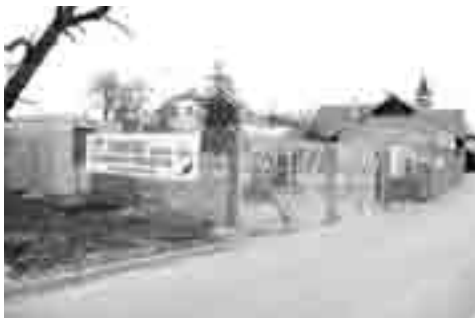
Začenja se gradnja nove stavbe.

Nekdanjo Škrlevo vinsko klet, ki je kar nekaj časa žalostno propadala, so vendarle podrli. Na Tržaški cesti bo na tem zemljišču zrasel poslovno stanovanjski objekt, ki ga je pričelo graditi domače gradbeno podjetje Treven, d.o.o.