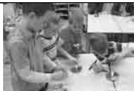
Kakšna barva bo nastala, ko bom zavrtel vrtavko?