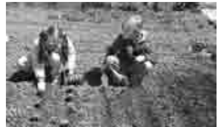
In zeliščni vrt bo ozelenel.