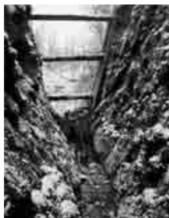
Rešetke in umetno skopani kanal do požiralnika Jačka 3

Zadnje večje poplave so bile 29. januarja 1979. Po teh poplavah je bil na Reki zgrajen zadrževalni jez, in do zadnjih marčevskih dni leta 2009 voda za Jačko ni povzročala škode.