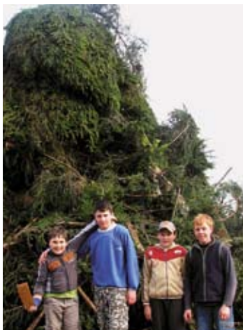
Tudi najmlajši kresovalci so pripravljali kres v Žibršah.

Navdušeno pričakovanje praznika dela ob žaru silnih zubljev