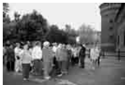
Pred trdnjavo Castello

K onec aprila je logaško Društvo invalidov v sodelovanju s potovalno agencijo Potepuh z Vranskega organiziralo dvo-dnevni izlet v