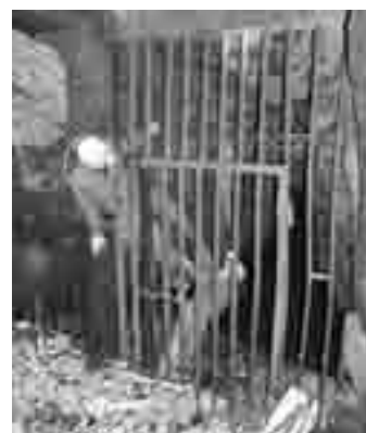
Vhod v požiralnik Jačka 3 je zavarovan z železno rešetko, mimo katere ni enostavno priti