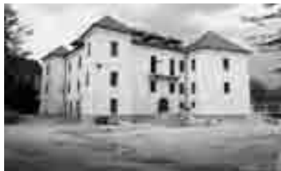
Stoji tam beli grad...

Obnovo delno financira Evropska unija – evropski sklad za regionalni razvoj. Investitor obnove gradu – Hotela Historia grad Logatec – je investicijsko podjetje Artcom d.o.o. Izvajalec obnove