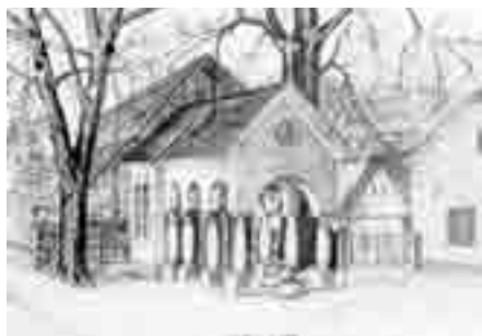
Kapelica žrtvam 1. svetovne vojne.

Povabilu na prvi prikaz njegovih likovnih del so se odzvali številni sorodniki, prijatelji in ljubitelji slikarske umetnosti. Vse prisotne so v otvoritve-