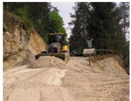
Prenavljanje ceste v Žibršah

V maju bo prenovljena in asfaltirana tudi cesta v Žibršah – od nekdanje šole proti kmetiji odprtih vrat Tumle. Zemeljska dela opravlja družba TGM Žakelj, za asfalt pa bo poskrbelo Primorje.