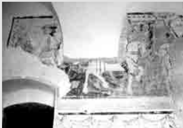
Ostarek srednjeveške freske v cerkvi sv. Janeza.

V Gornjem Logatcu je prikazan starejši tip z mladim in srednjim kraljem v pohodu in starim v poklonu. Zaradi barokizacije cerkve je freska mestoma uničena. Najmlajši kralj skrajno levo je ohranjen razmeroma dobro. Lepo se vidi še njegov obraz z značilnimi velikimi jajčastimi očmi, krompirjastim nosom in majhnimi usteci. Od srednjega vidimo le še del