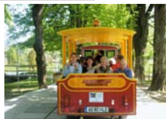
Z vlakom na sejem.

Naslednjega dne po izletu so nas obiskale učenke Glasbene šole Logatec. Igrale so nam na citre, violino, kitaro in flavto. Nekatere skladbe smo prepoznali: Slišala sem ptičko pet, Poletna noč, Le predi, dekle, predi ... Bilo je zelo prijetno.