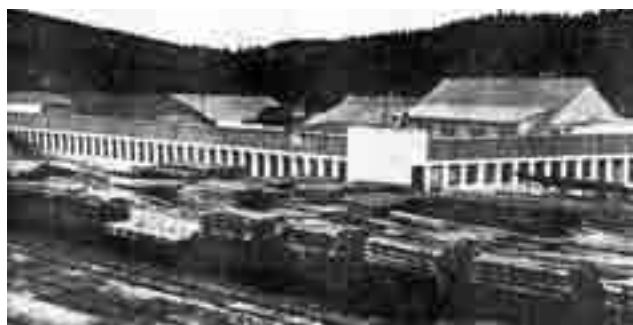
Tako je nekoč nastajal KLI - ponos Logateca.