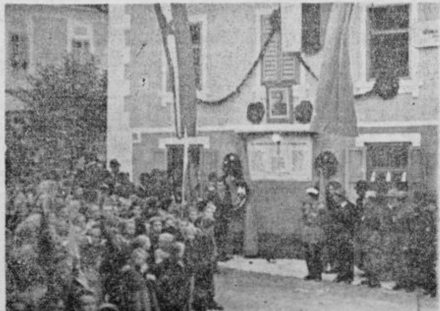
Odkritju spominske plošče na občinski hiši je prisostvovalo mnogo ljudi

la potrebna zaradi tega, ker katastr 1. januarja 1954, ko so se določili davki na dohodek od kmetijstva, v mnogih primerih zaradi raznih vzrokov niso ustrezali resničnemu stanju. Zaradi tega je treba spremeniti kataster pa tudi višino davkov za letošnje leto.