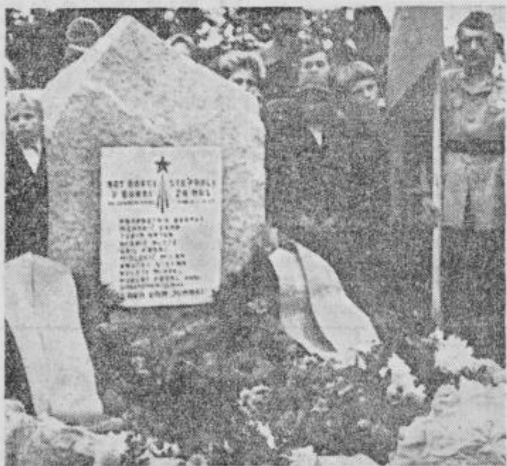
Spomenik padlim talcem

Ni dvoma, da bodo prihodnji občinski prazniki Makol po zgledu prvega spreminjali iz gled kraja in da bo vedno velika udeležba rezultat skrbno pripravljene programa. VJ.