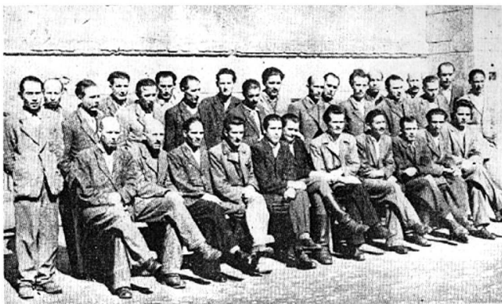
VLOMILSKA TOLPA. SLIKA POSNETA ENO URO PRED IZREKOM SODBE

1946 vse kolonizirala v Banatu, kjer so dobili lepa posestva. Po par mesecih, ko so gospodarstvo uničili, so se pa večinoma vsi zopet vrnili v Prekmurje, kjer so pričeli s starim načinom življenja. Res je, da gredo po par mesecev v letu na sezonsko delo, vendar pa zopet povsod kjer se pojavljajo vlamljajo in kradejo. Predlagamo, da se navedeno grupo vlomilcev zelo strogo kaznuje, da bo kazen služila za vzgled ostalim 14 (poudaril M. K.).