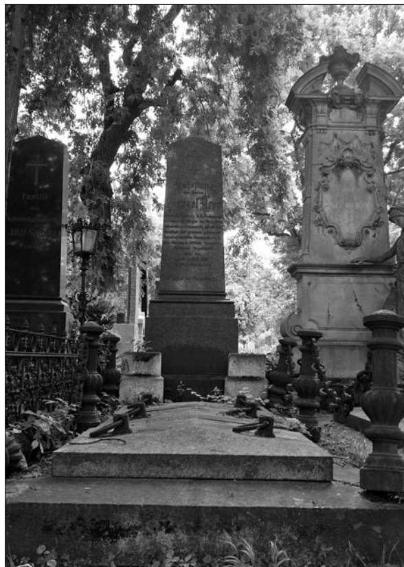
Arkov nagrobnik na dunajskem centralnem pokopališču.

V členih 2–5 je v testamentu razdelal različne opcije, kdo naj po njegovi smrti deduje vse njegovo premoženje. V drugem členu je tako za svoja dediča določil brata Jožefa, višjega uradnika v Trstu, in sestro Heleno, poročeno Vesel, ki bi prejela vsak po polovico njegove dediščine. 33 V oporoki je predvidel dediče tudi za primer, če bi njegova sestra umrla pred