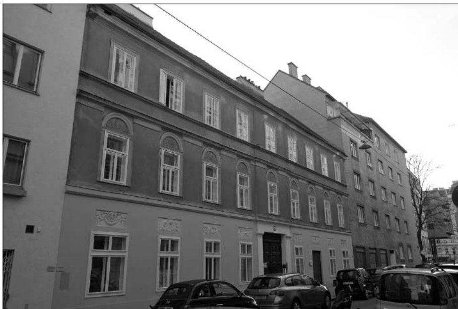
Posthorngasse 5 leta 2019.

Ob omenjenih različnih dejavnostih se je Arko preizkusil tudi na političnem parketu, vendar tu ni imel uspeha. Prav tako ga ni imel v zakonskem živ-