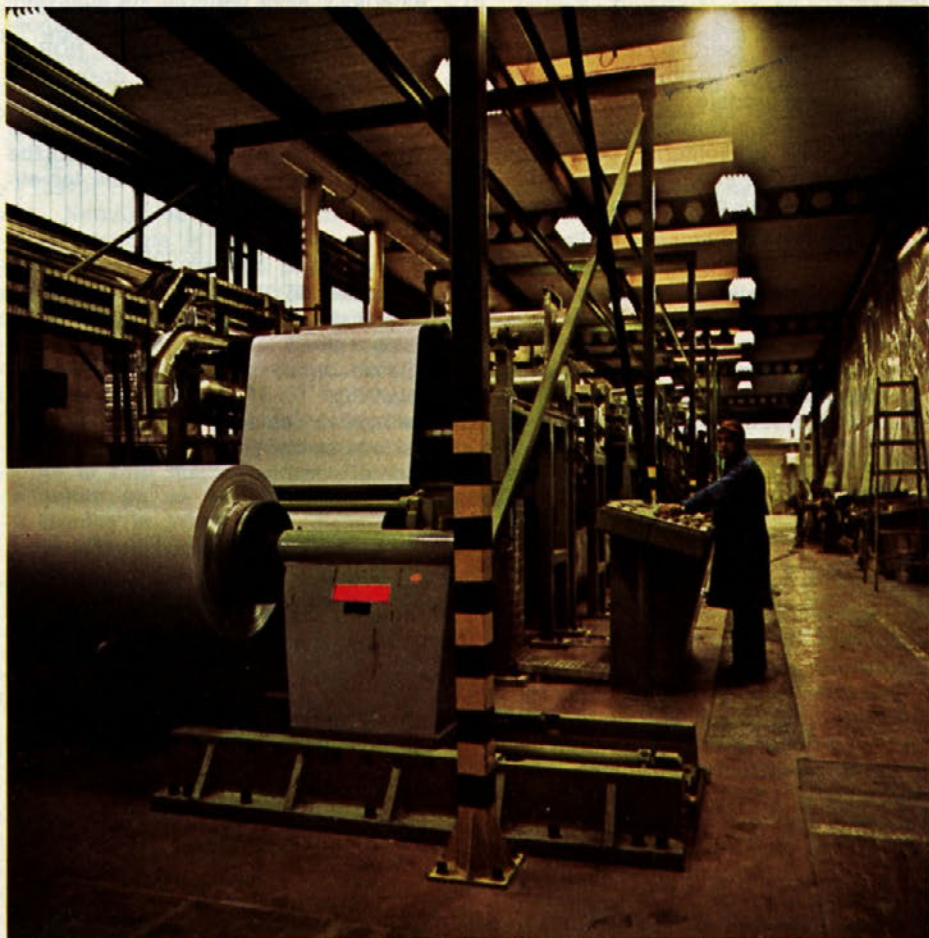
Novi obrat tiskarskih plošč v TOZD Grafika