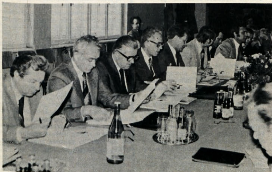
PREDSTAVNIKI CK ZKJ