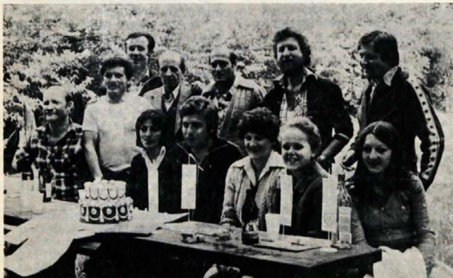
Ekipa TOZD TIO, in njihova zaslužena torta