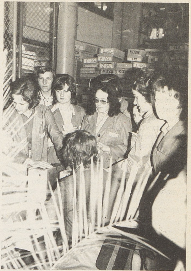
NAŠA MOČ JE V SAMOUPRAVNIH ODLOČITVAH