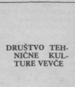
DRUŠTVO TEHNIČNE KULTURE VEVCHE