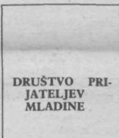
DRUŠTVO PRIJATELJEV MLADINE