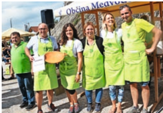
Člani Turističnega društva Hraše so po oceni obiskovalcev skuhalo najboljši grajski lonec.

Za Turistično društvo Smlednik in za pohodnike je to nova velika pridobitev. Društvo ima že več kot šestdesetletno zgodovino delovanja, ki se od samega začetka vrti okrog razvalin in z nji-