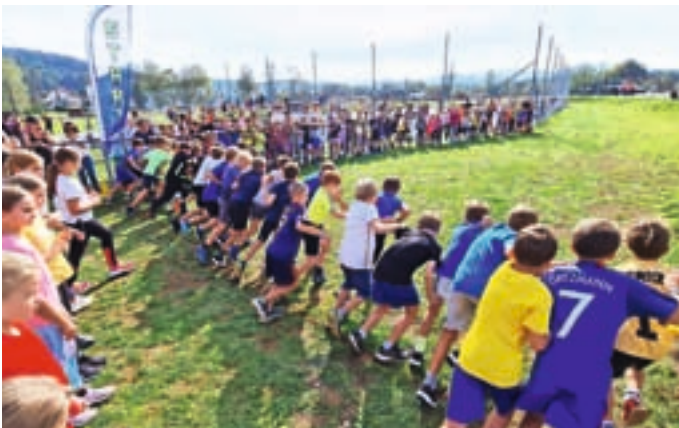
Na občinskem prvenstvu v krosu je bila tudi letos dobra udeležba.

Osnovnošolci so se v Smledniku pomerili na občinskem prvenstvu v krosu. Potekal je v organizaciji Javnega zavoda Sotočje in Osnovne šole (OŠ) Simona Jenka Smlednik.