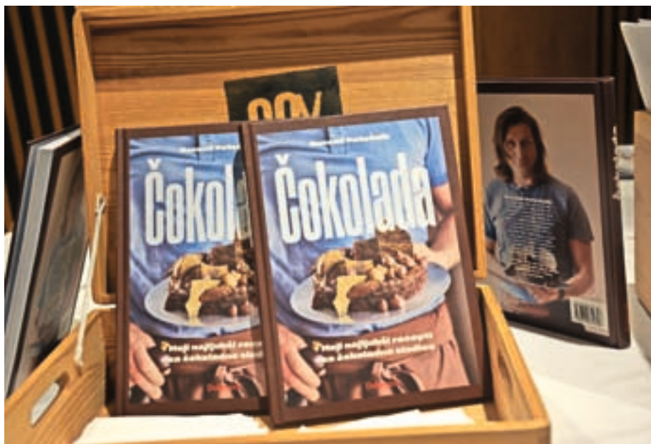
V knjigi z naslovom Čokolada je štirideset receptov za čokoladne slaščice iz vseh vrst čokolade in za vse okuse ter ravni znanja – od otročje lahkih sladkosti do mojstrov, ki so izziv za domače slaščičarske mojstre.

Narediš ga iz zelo osnovnih sestavin. Vajeni smo ga delati iz vrečke, kjer pa je samo škrob, kakav, potem dodaš sladkor in mleko. Sem pristaš pudinga iz pol mleka, pol mlečne smetane, malo rjavega ali kokosovega sladkorja, nežno vmešaš čokolado, ne kakav, počakaš, da se strdi, in uživaš. Ljudje so morda še vedno premalo izobraženi v tej smeri, da bi šli korak nazaj in razmislili, kaj