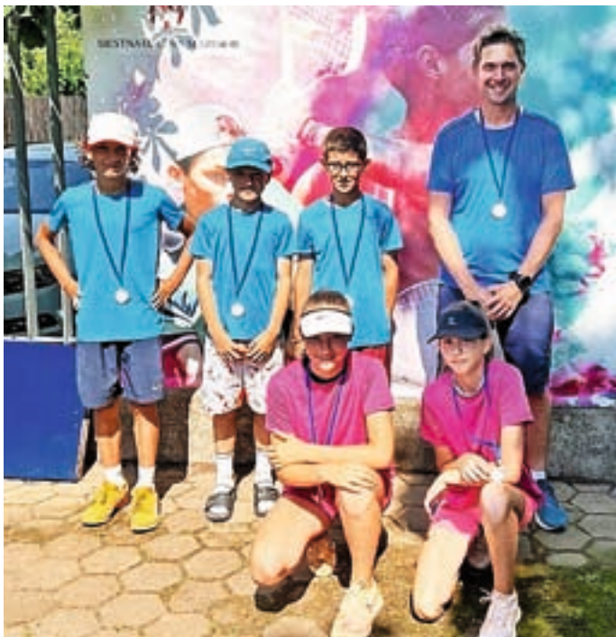
TK Spin Medvode ima tudi zelo dobro generacijo deklic in dečkov do 12 let.

Člani Teniškega kluba Spin Medvode še naprej nastopajo zelo uspešno. Leto 2021 so na klubski lestvici najboljših klubov v Sloveniji končali na odličnem četrtem mestu in še izboljšali peto mesto iz leta 2020, zelo dobro pa jim kaže tudi letos.