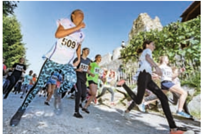
Učenci in dijaki so se na Starem gradu pomerili za naslove državnih prvakov v gorskem teku.