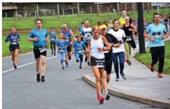
Medvoškega teka so se udeležili številni rekreativci različnih generacij. Skoraj tristo jih je krožilo po Medvodah.