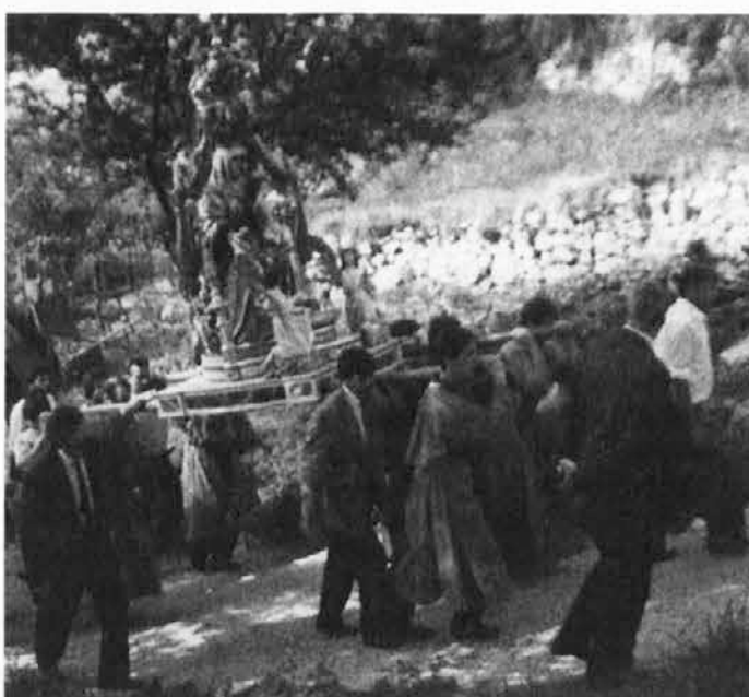
Procesija z Matero božjo na Bandimici v Čeneboli

Pojdita na Bandimico v nediejo v Cenebolo: parsezemo, de se bota imiel zaries dobro.