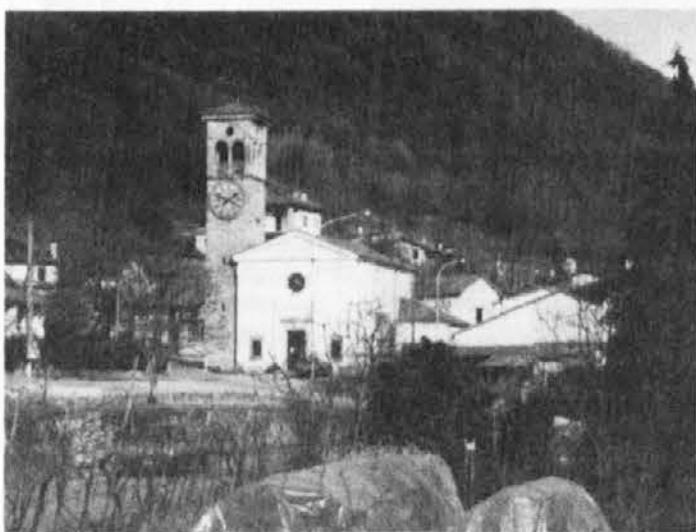
Motiv iz Kozce