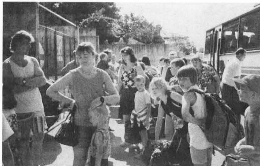
Se zadnji pozdrav mami an tatu an se gre na muorje

Dobra skupina beneških otuok je letos letovala v Sloveniji