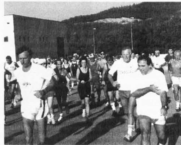
Un gruppo di podisti al momento della partenza

Successo di partecipazione sui tre percorsi della corsa organizzata dalla sottosezione Cai di S. Pietro al Natisone