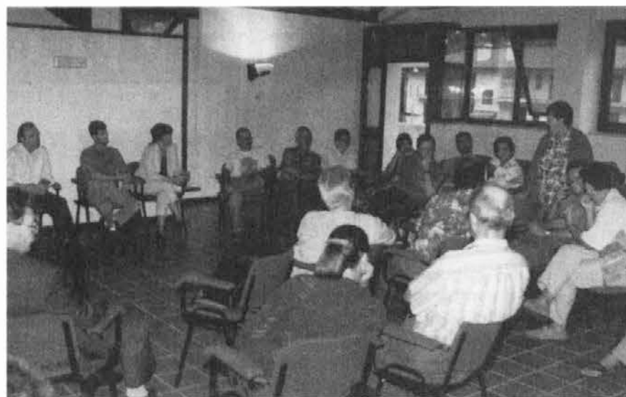
Alcuni partecipanti al corso sindacale a Pulfero