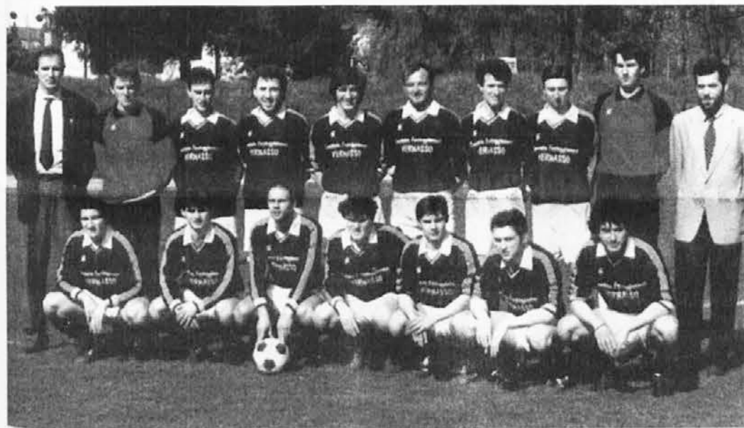
La Valnatisone (in una foto della scorsa stagione) è attesa al debutto con la Gemonese