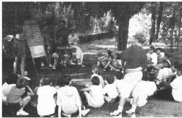
Giochi per bambini in occasione della Festa dei borghi

Ne smemo namreč pozabiti, da je reševanje političnih zapletov na videmski Občini pod zarometi deželne politične stvarnosti, saj gre za največjo občino in za najpomembnejše središče vsakršnega političnega dogovarjanja.