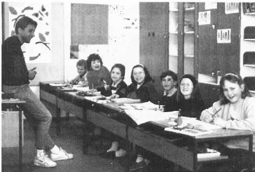
Med poukom v špetski dvojezični šoli

Novembra v Špetru pomemben mednarodni posvet