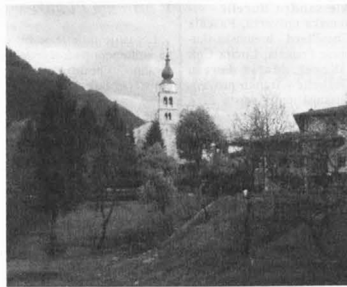
Motiv iz Rezije

Delo raziskovalcev pa je pomenilo tudi srečanje s tamkajšnji kulturnimi delavci, s člani folklorne skupine kakor tudi z upravitelji, da bi spoznali zdajšnjo stvarnost Rezije in Rezijanov. (R.P.)