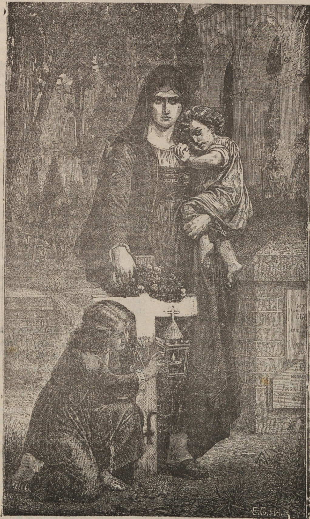
Vseh vernih duš dan.