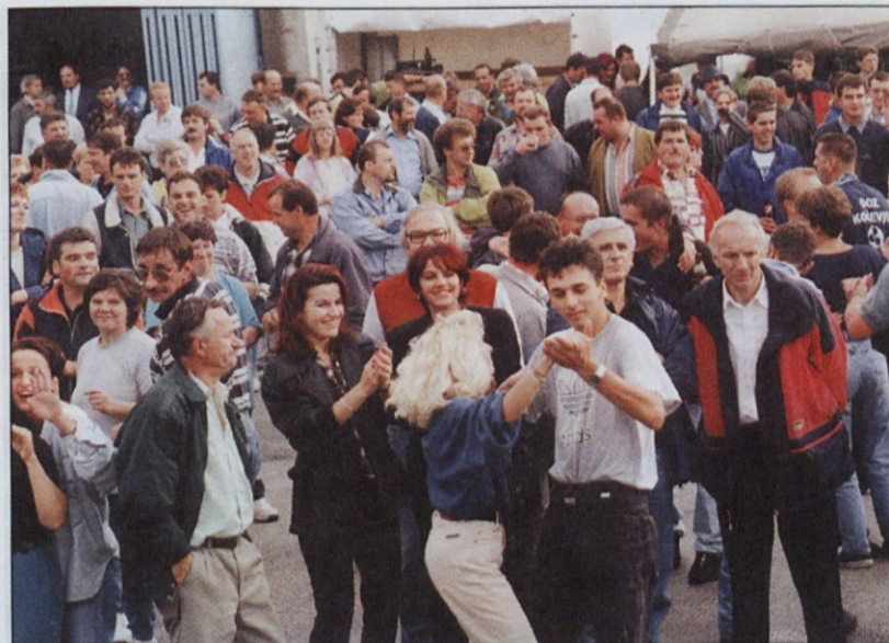
Vesetje in gibanje sta dobra naložba v zdravje. K temu sta pomagala zlasti Korado in Brendi ter ansambel Obzorje.

Sindikato obrtnih delavcev Slovenije je skupaj s skladi za izobraževanje delavcev pri samostojnih podjetnikih prejšnjo soboto organiziral tradicionalno, že šestnajsto srečanje. Delavci, zaposleni pri samostojnih podjetnikih, so si najprej ogledali obrtni sejem, družabno sre-