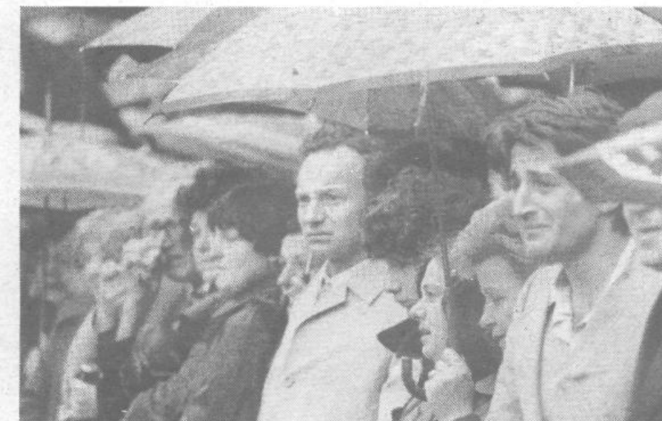
Njegovo delo je bila slutnja zarje. Z delom bomo dvignili to zarjo – vstala bo za vse.