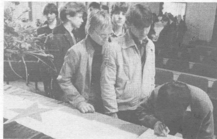
Ljubezen ne umre, zato tudi ti ne moreš umreti, ker te ljubimo...

– Titov sklad za štipendiranje mladih delavcev in otrok delavcev v SR Sloveniji 50100-655-50108 Ljubljana.