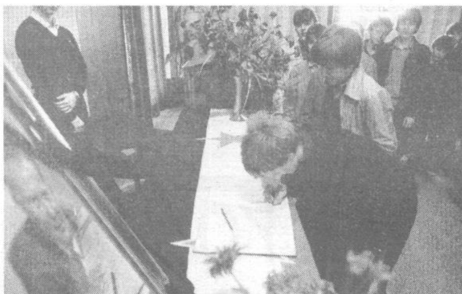
Bil si večji od smrti in večji od življenja