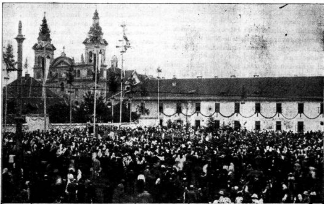
Pri Sv. Petru v Ljubljani blagoslavlja nove zvonove.

2. Molimo za poslance! — Tudi ti spadajo med tiste ljudi, ki čolnarijo po valovih. Skušajo jih prekucniti vidne in nevidne sile. Čimbolj je kdo vnet za vzore krščanskega ljudstva, tembolj mu preti skrita jeza temnih moči. Marsikdo, ki javno deluje, kar čuti, če ga podpirajo doma molitve ljudstva. Zaradi molitve dobre angeli moč, da morejo odgnati hudobne; zaradi molitve navdihujejo poslance z dobrimi mislimi in celo nasprotnike. — Iz sv. pisma je znano, kako so angeli zaradi molitve vernih mož vplivali celo na poganske viadarje, da so dobro storili njihovemu ljudstvu. Molimo torej za javne zastopnike!