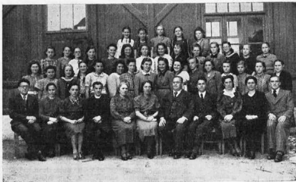
Absolventke 4. b razreda v šolskem letu 1939/40