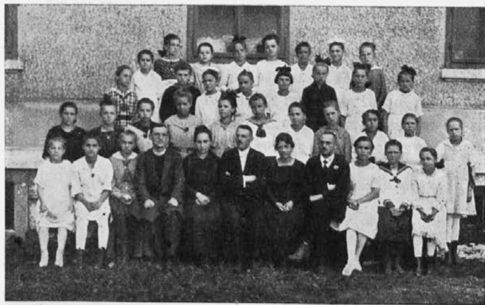
Učenke (1. a razreda) v šolskem letu 1920/21

Šola upa, da bo svojo petindvajsetletnico praznovala že v novi šolski zgradbi.