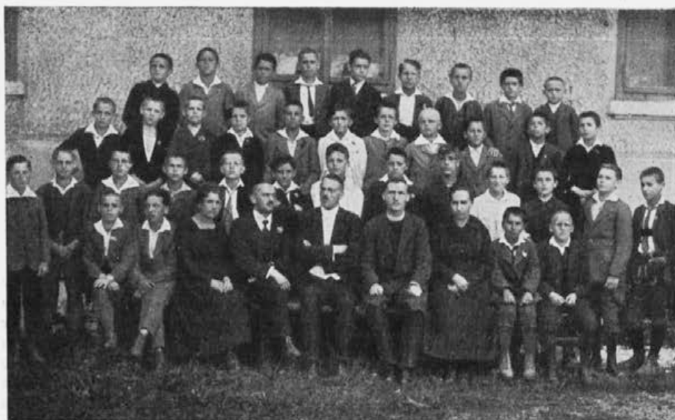
Učenci v šolskem letu 1920/21