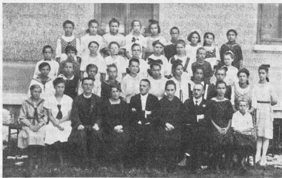
Učenke (1. b razreda) v šolskem letu 1920/21